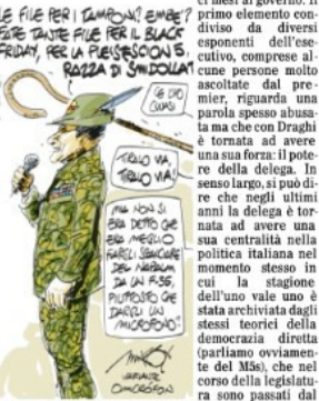
LE FIE PERI L'AMORNO EMBET...