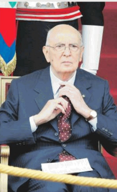
PARTIGIANO? Giorgio Napolitano, ex comunista ed eletto al Colle

Divisivo. Questa parola scende come un incantesimo di difesa sul Quirinale. Silvio Berlusconi non può neppure sognare la presidenza della Repubblica.