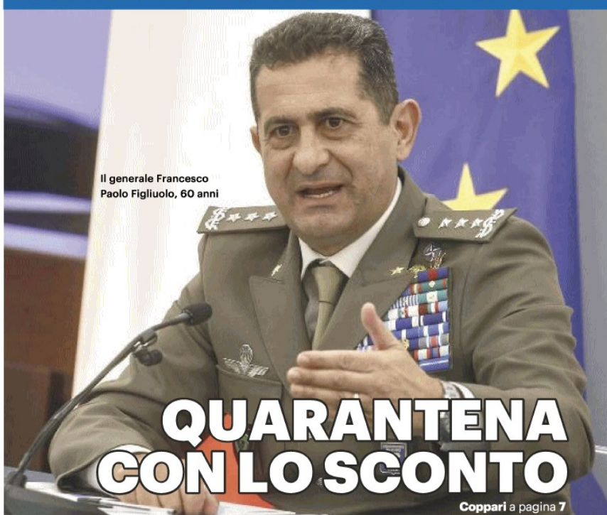
Il generale Francesco Paolo Figliuolo, 60 anni

SISTEMA IN TILT, DECINE DI MILIONI DI ITALIANI A RISCHIO LOCKDOWN L'IPOTESI DEL GOVERNO: ISOLAMENTO RIDOTTO PER CHI HA LA TERZA DOSE