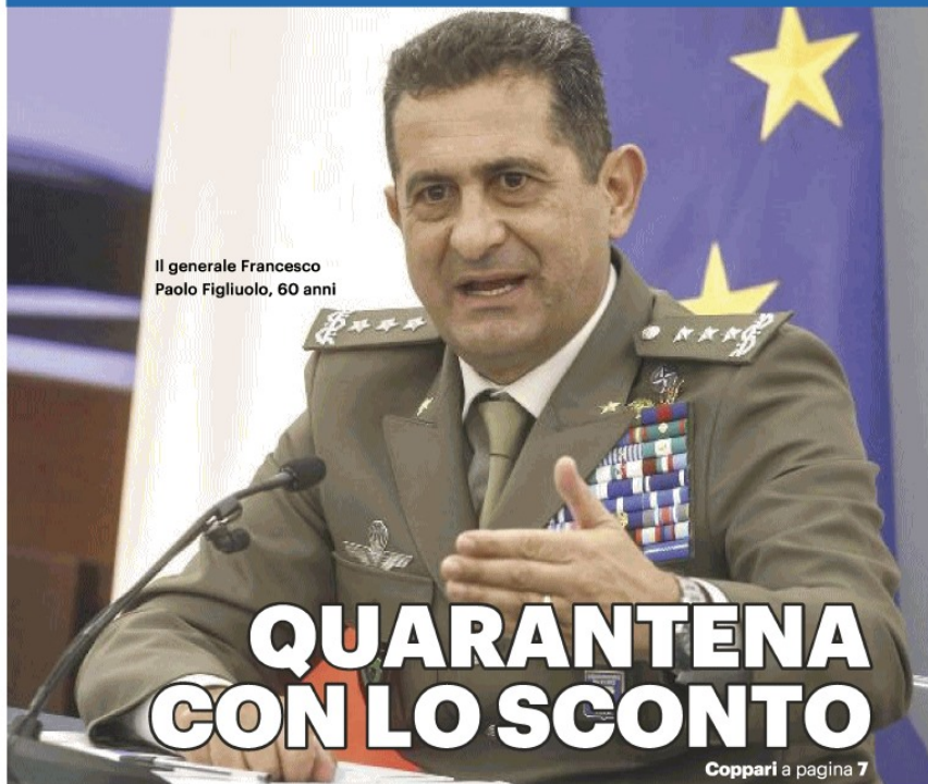
Il generale Francesco Paolo Figliuolo, 60 anni

SISTEMA IN TILT, DECINE DI MILIONI DI ITALIANI A RISCHIO LOCKDOWN L'IPOTESI DEL GOVERNO: ISOLAMENTO RIDOTTO PER CHI HA LA TERZA DOSE