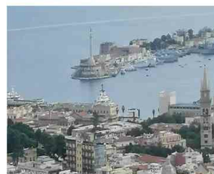
Procedure amministrative digitalizzate nei Porti dello Stretto

Redazione | lunedì 27 Dicembre 2021 - 13:05