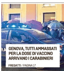
GENOVA, TUTTI AMMASSATI PER LA DOSE DI VACCINO ARRIVANO I CARABINIERI FREGATTI / PAGINA 17

In Liguria quadruplicati in un mese i ricoveri non gravi: la zona arancione possibile dal 10 gennaio