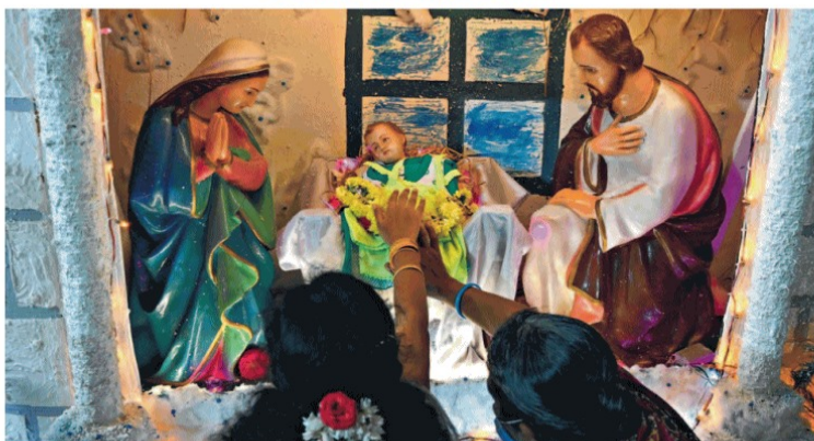
▲ Natale. Alcuni fedeli cristiani pregano in una chiesa a Chennai, India