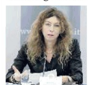
IL VIDEO Erika Stefani