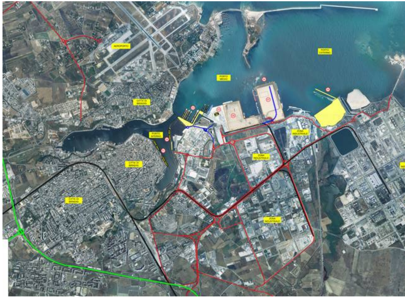
Figura 1_ Il bacino portuale con i principali collegamenti ferro gomma: in verde l'arteria a scorrimento veloce SS 379 BA LE; in rosso primaria viabilità di raccordo; in nero esistente linea ferroviaria; in blu la realizzanda connessione ferroviaria di Costa Morena e la nuova viabilità urbana di collegamento tra il piazzale di S. Apollinare e Costa Morena Ovest.

Risulta, inoltre, in itinere un importante procedimento finalizzato alla migliore connessione dell'infrastruttura portuale con la linea ferroviaria nazionale. Il Comune di Brindisi, infatti, con il significativo contributo finanziario dell'Autorità Portuale, ha in corso l'attuazione di interventi di potenziamento ferroviario, finanziati nell'ambito del PIT7 "Brindisi" quali il "nuovo raccordo ferroviario tra la zona retroportuale e la linea nazionale LE - BO", il "potenziamento del raccordo ferroviario a servizio dell'area retroportuale" ed il "completamento e miglioramento della viabilità della zona industriale a supporto del bacino