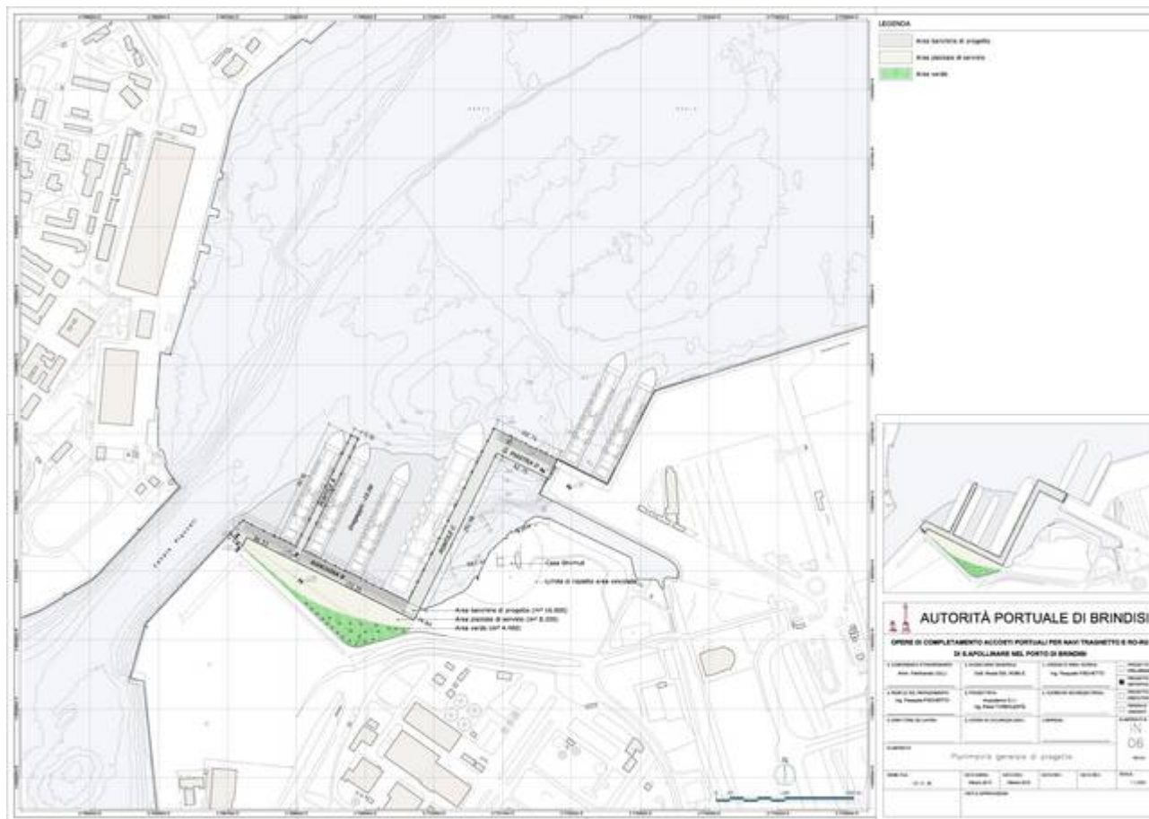
Figura 3_ Adeguamento Tecnico Funzionale approvato con Delibera G.R. n° 40/2013

In considerazione della residua valenza pianificatoria del vigente P.R.P. ed in ottemperanza al dettato legislativo (art. 5 della L. 84/94), ha imposto l'avvio, sin dal 2014, dell'iter per la redazione di un nuovo Piano Regolatore.