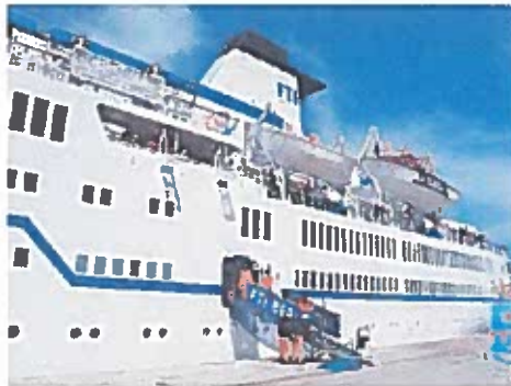
Una delle navi attraccate a Manfredonia

Al tavolo tecnico hanno preso parte i rappresentanti dell'Agenzia De Girolamo, l'amministratore unico dell'Agenzia del Turismo Sa-