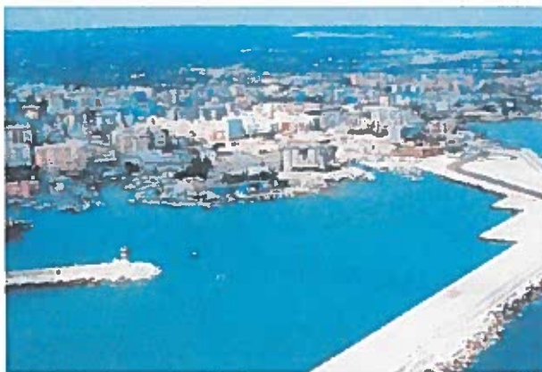
MONOPOLI È uno dei porti dell'Autorità del sistema portuale del Mare Adriatico

di piccola stazza arriviandovi così accostati che non avevano tradizione in loco e destinate a crescere, anche grazie all'attrazione dei grandi santuari del Gargano e allo splendore delle sue coste.