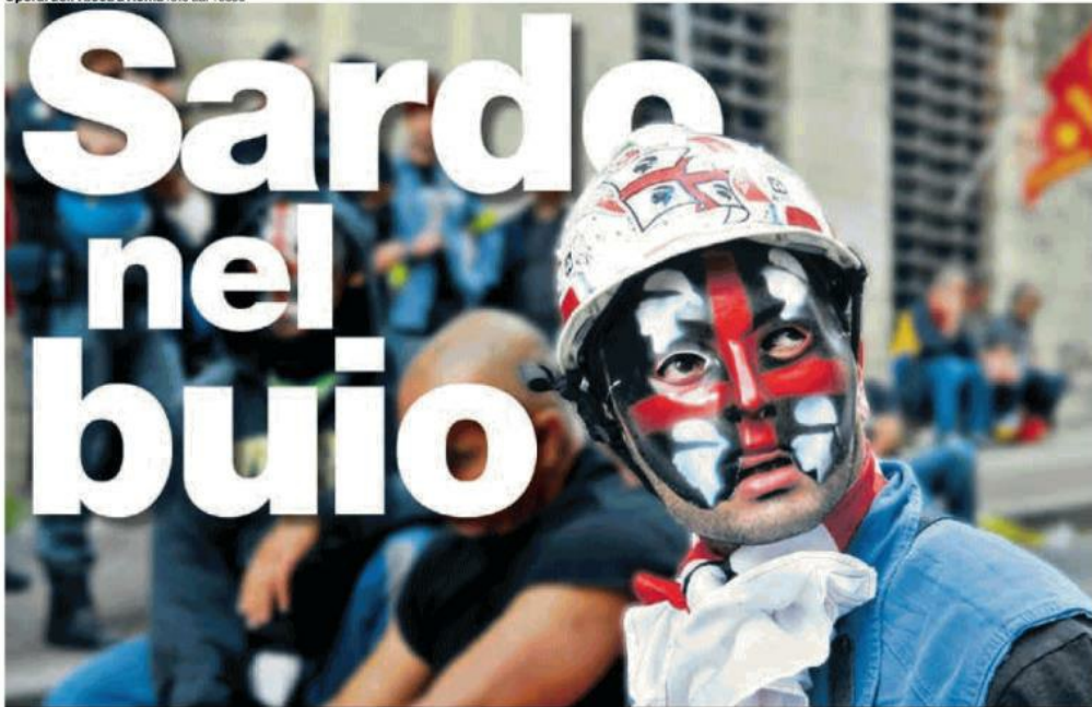
Operai dell'Alcoa a Roma

Sardo nel buio. Con una disoccupazione alle stelle e le industrie ridotte al lumicino, la Sardegna va alle urne. Sul voto regionale il peso della protesta dei pastori e l'emigrazione giovanile. Incubo astensione. Il centrodestra tenta il bis dell'Abruzzo. Il centrosinistra di Zedda spera. I 5 stelle tremano pagine 2,3