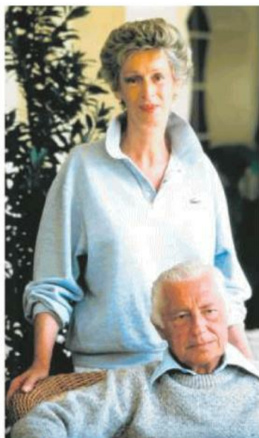
DI NUOVO INSIEME Marella Agnelli con il marito Gianni