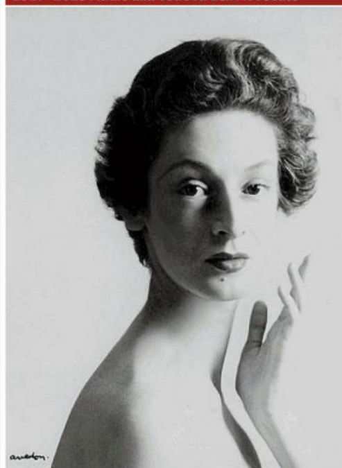
Marella Agnelli fotografata da Richard Avedon, a New York, nel dicembre del 1953