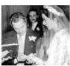
Le nozze di Gianni e Marella

È una fredda giornata, quando nella cappella del castello di Osthoffen, il 19 novembre, 1953, la giovane principessa Caracciolo sposa l'avvocato Giovanni Agnelli, lo scapolo d'oro erede della Fiat che aveva conosciuto grazie alle sue sorelle Susanna, Maria Sole, Clara e Cristiana. La mamma Margaret teme la fama di dongiovanni, il padre Filippo Caracciolo concede la