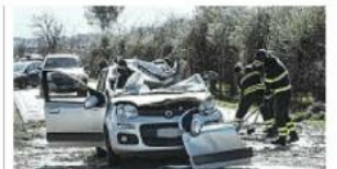
L'auto schiacciata da un albero a Guidonia, morto il conducente

Gelo, neve e forte vento, alberi e muri crollati. Cinque i morti nel Lazio, dove un padre salito per sistemare le tegole è precipitato dal tetto schiacciando e uccidendo il figlio di 15 anni. Mareggiate in tutto il Sud, fiocchi bianchi sulle spiagge della Calabria. A Bari si è arenato un mercantile.