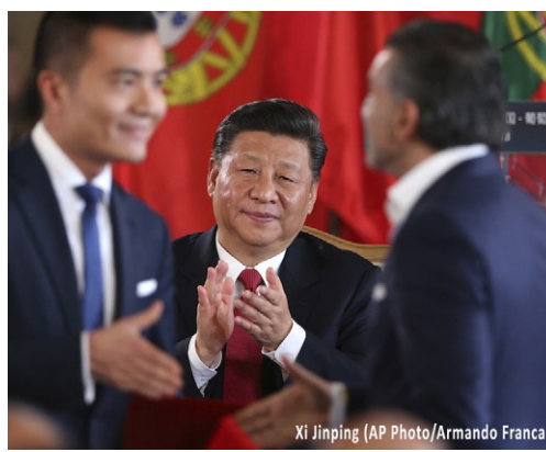
Xi Jinping

ficato nel 2017, dove si legge che il partito «deve migliorare costantemente i rapporti tra la Cina e i paesi vicini e lavorare per rafforzare l'unità e la cooperazione tra la Cina e gli altri paesi in via di sviluppo», «raggiungere una crescita condivisa attraverso discussione e collaborazione, e perseguire l'iniziativa della yi dai yi lu». Una cintura, una via, o come viene più spesso chiamata, la