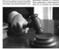
Il funzionario pubblico che aveva agevolato l'accertamento della responsabilità erariale del primo cittadino, è stato demansionato per ritorsione.