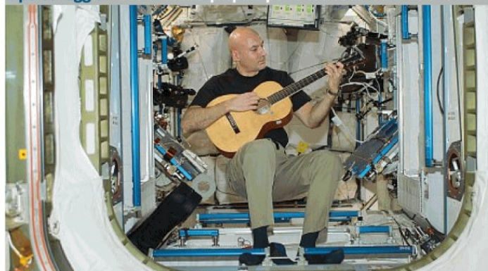
L'astronauta Luca Parmitano (42 anni) in una foto del 2013 mentre suona la chitarra nella Stazione spaziale internazionale