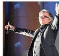
Gli Stadio in concerto