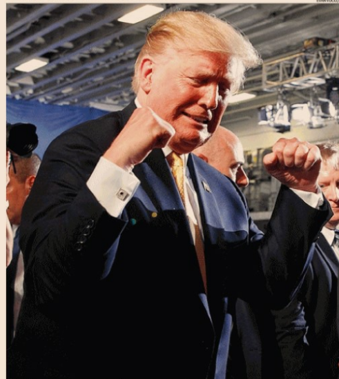
Prova di forza. Il presidente Usa Donald Trump mostra i muscoli e si prepara ad alzare nuove barriere protezionistiche