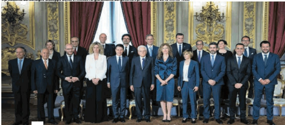
Il presidente del consiglio Giuseppe Conte e i ministri al giuramento del governo il primo giugno 2018