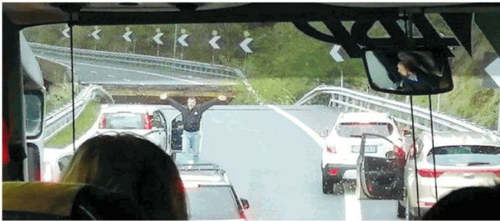
Il maltempo flagella l'Italia. Una frana ha travolto un ponte della Torino-Savona. Nella foto il vigilante si sbraccia e ferma le auto dopo il crollo. da pagina 2 a pagina 6

P ossiamo continuare ad affidare il nostro destino a Giovanni Nepomuceno martire, il Santo protettore dalle frane e dalle alluvioni? Quel vuoto spettrale tra i due monconi mozzati e rimasti in piedi del viadotto dell'Autostrada A6 Torino-Savona, travolto da una frana, ci riporta di colpo indietro di quindici mesi. A quel Ferragosto 2018 in cui sotto la pioggia battente si schiantò al suolo a Genova, una cinquantina di chilometri più in là, il ponte Morandi. Certo, stavolta il bilancio non è apocalittico come allora. Ma quanto ha pesato la buona sorte, assai poco conosciuta, storicamente, dalla manutenzione quotidiana delle nostre infrastrutture? I rilievi dei vigili del fuoco, le analisi degli scienziati, le indagini della magistratura diranno se e in quale misura c'entrino anche stavolta l'incuria e la sciattezza, plaghe che negli anni sono diventate un incubo. Certo è che la nuova batosta conferma, più ancora delle immagini di tanti altri viadotti vetusti e vistosamente aggrediti dal tempo, dal sale o dalla ruggine, la necessità assoluta di un monitoraggio capillare dello stato di sicurezza della nostra rete viaria. Tanto più dopo la rivelazione di qualche giorno fa: un report del 2014 parlava già per il ponte di Genova di un «rischio di perdita di staticità». continua a pagina 5