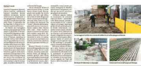
Le spiagge di Albissola e Albisola Capo sono ricoperte da mezzo metro di materiale, soprattutto tronchi d'albero, rami e arbusti.

Nella Piana, aziende agricole vittime in parte dei danni. Le Cio: costi soprattutto alberi, ortaggi e piante ornamentali