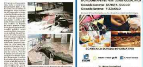
Le spiagge di Albissola e Albisola Capo sono ricoperte da mezzo metro di materiale, soprattutto tronchi d'albero, rami e arbusti.