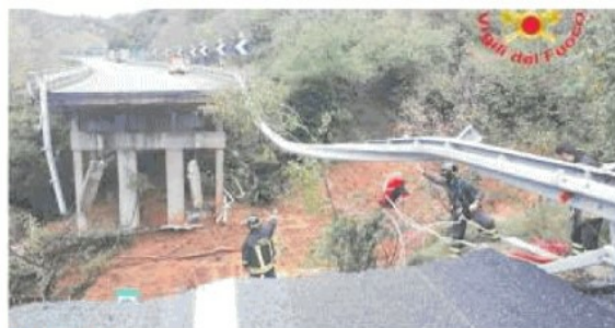
ITALIA SPEZZATA I vigili del fuoco intervengono sul viadotto della Torino-Savona travolto dal fango