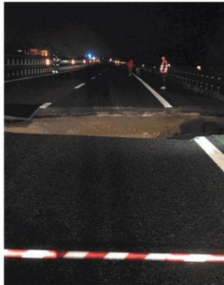
La voragine che si è aperta sulla Torino-Piacenza SERVIZI - PP. 2-5