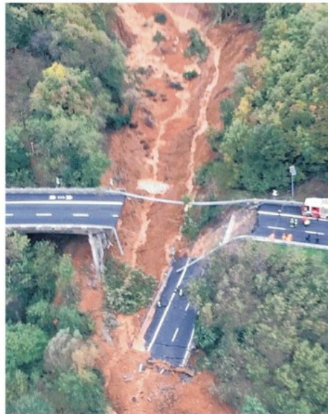
Il viadotto crollato sulla Torino-Savona nei pressi del casello di Altare

Cedimenti sulla Torino-Savona e sulla Torino-Piacenza: traffico bloccato. Piemonte, centinaia di sfollati