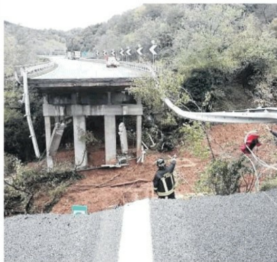
Il sopralluogo dei vigili del fuoco sul tratto del viadotto crollato sulla Torino-Savona

► Incubo maltempo, sull'autostrada Torino-Savona frana la montagna: piloni travolti L'automobilista-eroe: «Ho fermato tutti». Costa: «Va sbloccato il piano anti-dissesto»