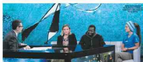
Luciana Lamorgese, ministro dell' Interno, con i ministri della Giustizia e della Sanità.

Il ministro dell' Interno, Luciana Lamorgese, ha parlato di «cambiamento di rotta» in tema di immigrazione. La nuova linea del governo Conte bis prevede l' apertura di porti italiani per lo sbarco dei migranti. La capitana Rachele ha criticato la passività di Fazio, il ministro della Giustizia, nel gestire la vicenda della scultura di Napoli. La Lega ha chiesto che Fazio sia in carcere.