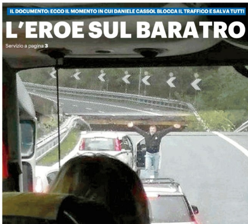
IL DOCUMENTO: ECCO IL MOMENTO IN CUI DANIELE CASSOL BLOCCA IL TRAFFICO E SALVA TUTTI