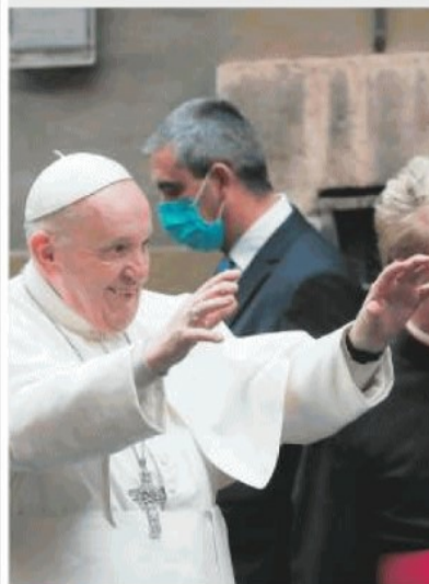
SCIVOLONE Papa Francesco saluta i cronisti senza mascherina

M isericordia per il Papa. A Roma è una mattina tiepida di primavera e Francesco viene scortato in auto fino alla chiesa di Santo Spirito in Sassetta, qui dove via dei Penitenziari si immerge nel cuore del Borgo, che deve il nome al vecchio ospizio che dava ristoro ai pellegrini inglesi: Burgus Saxonum.