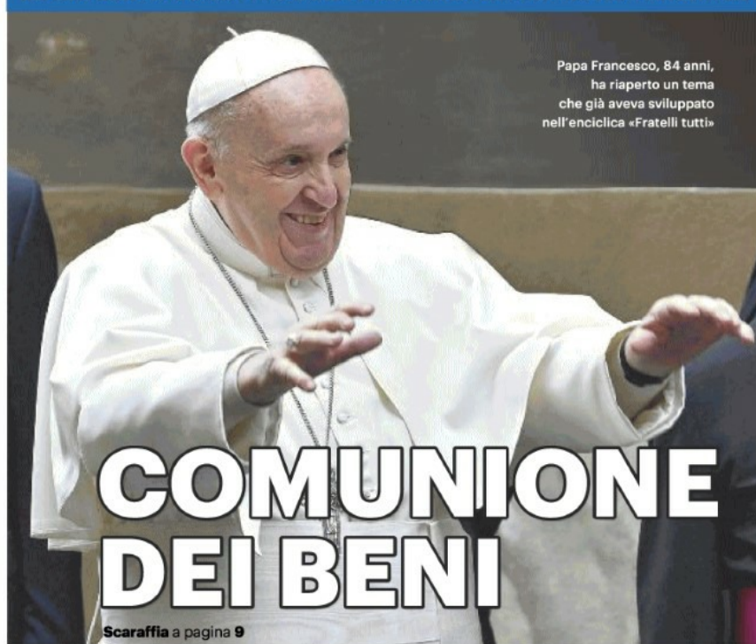
Papa Francesco, 84 anni, ha riaperto un tema che già aveva sviluppato nell'enciclica «Fratelli tutti»

«CONDIVIDERE CIÒ CHE SI HA NON È COMUNISMO, MA CRISTIANESIMO» IL PAPA RIAPRE IL DIBATTITO SULLA PROPRIETÀ PRIVATA TRA FEDE E POLITICA