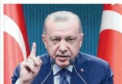
Recep Tayyip Erdogan