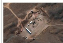
L'impianto di Natanz