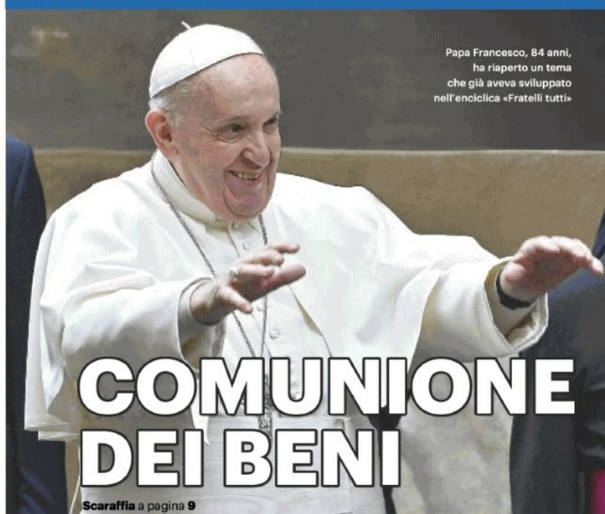
Papa Francesco, 84 anni, ha riaperto un tema che già aveva sviluppato nell'enciclica «Fratelli tutti»

«CONDIVIDERE CIÒ CHE SI HA NON È COMUNISMO, MA CRISTIANESIMO» IL PAPA RIAPRE IL DIBATTITO SULLA PROPRIETÀ PRIVATA TRA FEDE E POLITICA