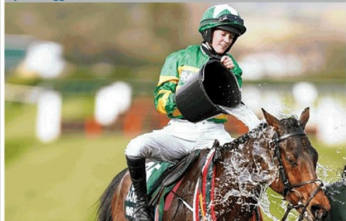
Rachael Blackmore, 31 anni, irlandese, rinfresca Minella Times, il cavallo con il quale ha trionfato al Grand National di Liverpool