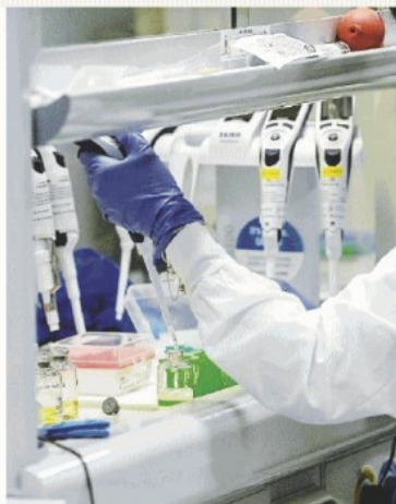
Terapia Ritardi nelle cure con gli anticorpi monoclonali

■ Finora meno di 2 mila pazienti hanno avuto la terapia degli anticorpi. Ancora ferme 38 mila dosi. E Figliuolo ne annuncia altre 150 mila. Oggi sotto la Camera manifestano gli "Io apr"