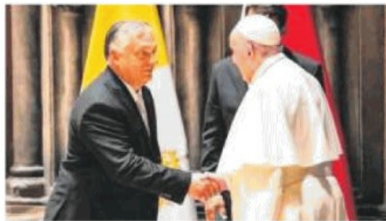
VISIONI DISTANTI Papa Francesco e il premier sovranista Orbán