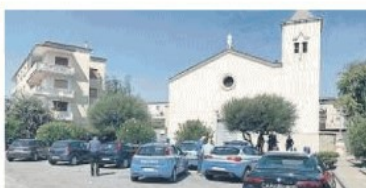
I rilievi di polizia e carabinieri sul luogo dell'omicidio