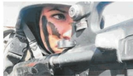
SANGUE FREDDO Una delle cecchine della resistenza ai talebani