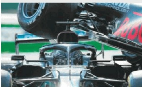
ANGOSCIA La ruota dell'auto di Verstappen sfiora la testa di Hamilton