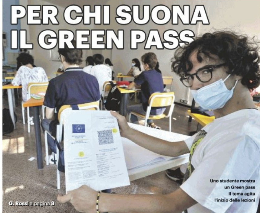
Uno studente mostra un Green pass. Il tema agita l'inizio delle lezioni