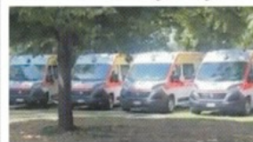
Sbraga a pagina 12

Mancano gli autisti Un'ambulanza su tre rimane in garage