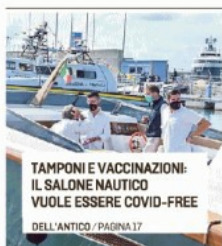
TAMPONI E VACCINAZIONI: IL SALONE NAUTICO VUOLE ESSERE COVID-FREE