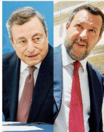
Governo Il premier Mario Draghi, il leghista Matteo Salvini.

■ Faccia a faccia tra i due, poi il Cdm sull'obbligo del certificato verde ai lavoratori di P.A., bar e palestre (ma il leghista è contrario ad altre estensioni). Sarà scontro anche sulle altre riforme