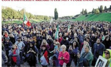
Una manifestazione al Circo Massimo di Roma contro il green pass

COM'È DIFFICILE PARLARE A CHI NON VUOLE IMMUNIZZARSI