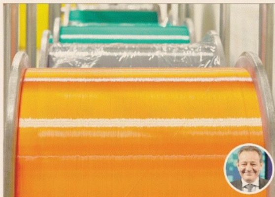
L'allarme. Il big italiano lamenta la stasi degli investimenti e la mancanza di standard per la realizzazione di reti in fibra