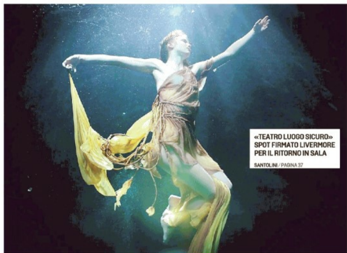
«TEATRO LUOGO SICURO» SPOT FIRMATO LIVERMORE PER IL RITORNO IN SALA SANTOLINI / PAGINA 37

Nuove assunzioni ed un finanziamento di 900 mila euro per la digitalizzazione dei documenti catastali. Sono gli impegni del ministero della Cultura per l'Archivio di Stato di Genova che, per due giorni (ieri e mercoledì), è rimasto eccezionalmente chiuso al pubblico per mancanza di personale. Oggi l'Archivio, che conserva documenti storici unici e preziosissimi per ricercatori e studenti, riaprirà la sala studio nella sede distaccata di Genova Campi, come tutti i venerdì, anche se il problema della carenza di personale che, in questi giorni, si è sommato alle assenze per malattia, non è ancora risolto. L'ARTICOLO / PAGINA 10