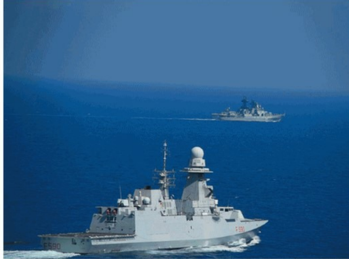
▲ Il duello La fregata italiana controlla la caccia russo "Ammiraglio Tributs" pochi giorni fa nell'Adriatico