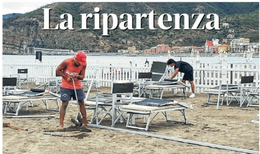
Gli addetti dei bagni Segesta di Sestri Levante al lavoro per rendere agibile la struttura, investita da una delle trombe d'aria di giovedì FLASH

FONDO DA 250 MILA EURO PER AIUTARE GLI SFOLLATI. COLPITE DURAMENTE L'AREA ARCHEOLOGICA DI LUNI E LA FORTEZZA DI SARZANA