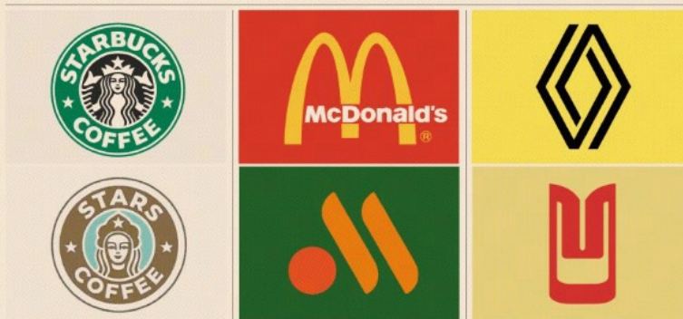
Cambi di casacca. Divenuto Stars Coffee, l'ex Starbucks riapre a Mosca con un nuovo logo. Tra i restyling di marchi e loghi in salsa russa, anche McDonald's e Renault

Starbucks lascia la Russia e a Mosca diventa Stars Coffee