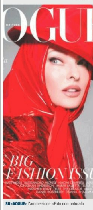
SU «VOGUE» L'ammissione: «Foto non naturali»