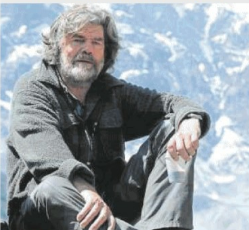
FURIBONDO Reinhold Messner non accetta la contestazione: «Ridicola»