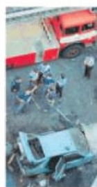
STRAGE Via d'Amello

Se colui che è ritenuto il più moderato dei candidati del centrosinistra, Carlo Calenda, dice che con la vittoria della destra l'Italia diventerà come il Venezuela, se il più cossigliano dei sinistri, Luigi Zanda, spiega che queste elezioni sono come quelle del 1948 con il rischio dei comunisti alle porte, che in questo caso poi sarebbero quelli di centrodestra, se praticamente tutto lo schieramento «progressista» considera la probabile vittoria della destra come una «sciagura profetizzata», ebbene, se il tono della campagna elettorale è questo, qualche cialtrone in giro per il mondo che ci crede davvero lo si trova.