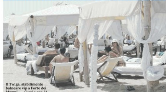
Il Twiga, stabilimento balneare vip a Forte dei Marmi - Corsi a pag. 14

A Forte dei Marmi niente oligarchi, ma molte presenze sulle spiagge vip