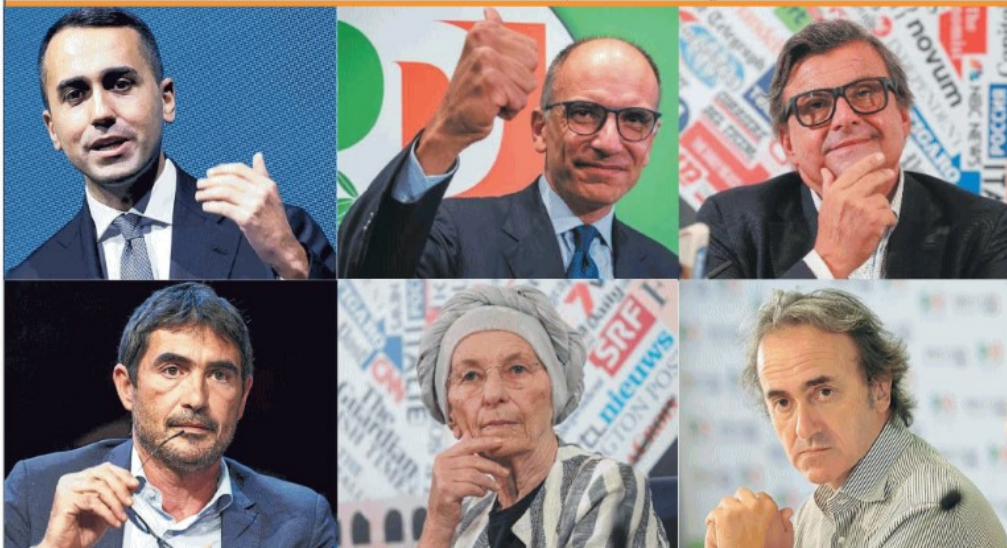
▲ I protagonisti Da sinistra, in senso orario: Nicola Fratoianni, Luigi Di Maio, Enrico Letta, Carlo Calenda, Angelo Bonelli ed Emma Bonino