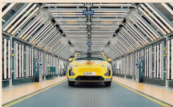
Made in China. L'industria dell'auto cinese alla conquista del mercato europeo (nella foto la Always U6)