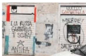
ALTRO CHE PACIFICAZIONE Le offese apparse a Roma dopo l'elezione di La Russa al Senato

Ma i paradossi non finiscono qui. Nell'elezione a presidente del Senato Ignazio La Russa ha usufruito dell'aiuto di Matteo Renzi, l'«ammazza governi». Ora è evidente che la sortita del terzo Polo punta a dividere la maggioranza: Calenda e Renzi hanno un disegno lucido - e per di più esplicito - staccare gli azzurri dalla maggioranza del prossimo governo per rilanciare uno schema simil-Draghi. In sintesi: la Meloni si è affidata nella partita di Palazzo Madama ai suoi più insidiosi avversari. L'ultimo paradosso è la «non curanza» verso il fattore aritmetico. Non ci vuole il pallottoliere per scoprire che gli azzurri sono determinanti sia alla Camera, sia al Senato. Anzi, la riduzione dei parlamentari senza che il Parlamento abbia adeguato la sua organizzazione ai nuovi numeri (specie Montecitorio) richiede una maggioranza che abbia margini non solo sufficienti ma ampi. In questa situazione mortificare un partito determinante, e i suoi parlamentari, è un comportamento che oltre un certo limite sfocia nel masochismo. Se si parla di un premier e di un governo che vogliano durare.