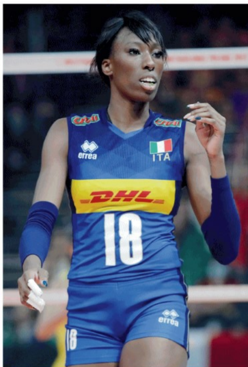
▲ La giocatrice Paola Egonu, 23 anni, è nata a Cittadella (Padova)