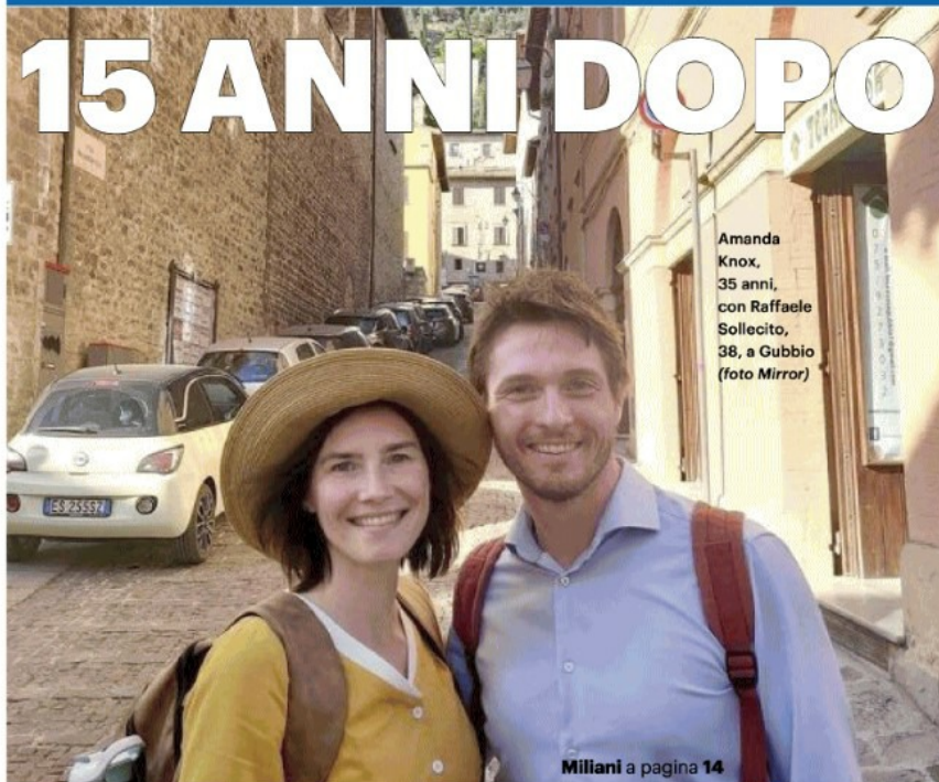
Amanda Knox, 35 anni, con Raffaele Sollecito, 38, a Gubbio