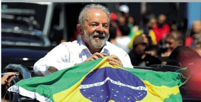
Il leader del partito dei lavoratori Luiz Inácio Lula da Silva, 77 anni appena compiuti, ha sconfitto Jair Bolsonaro, 67, candidato della destra