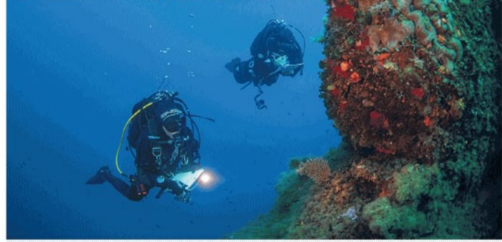
Un'immersione dei biologi marini per accertare i danni provocati dall'alta temperatura PIEMONTE / PAGINA 12