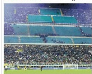
La Curva Nord resta vuota per ordine degli ultrà