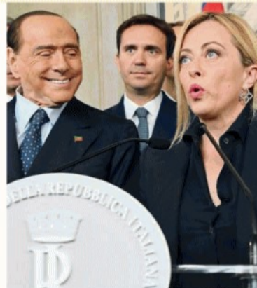
Destra contro destra Silvio Berlusconi e Giorgia Meloni

L'AUTOBIOGRAFIA "Dadauffa", così Rettore racconta musica e canzoni RETTORE A PAG. 18