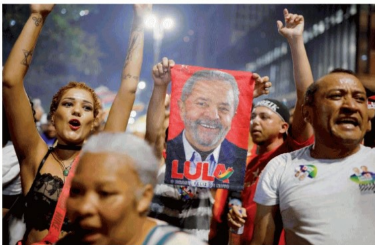
I sostenitori di Lula festeggiano a San Paolo il terzo mandato (non consecutivo) del presidente