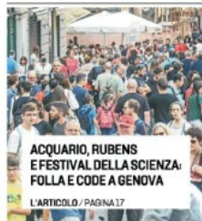
ACQUARIO, RUBENS E FESTIVAL DELLA SCIENZA: FOLLA E CODE A GENOVA

La stagione d'oro del turismo ligure prosegue, aiutata dal clima mite. A settembre quasi 2 milioni di presenze: 100 mila in più che nel 2019. E a ottobre il trend è lo stesso. La Regione rinnova i voucher per assumere stagionali. MATTEO DELL'ANTICO / PAGINA 16