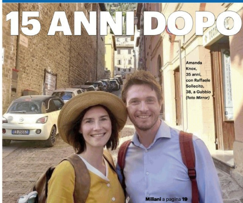
Amanda Knox, 35 anni, con Raffaele Sollecito, 38, a Gubbio