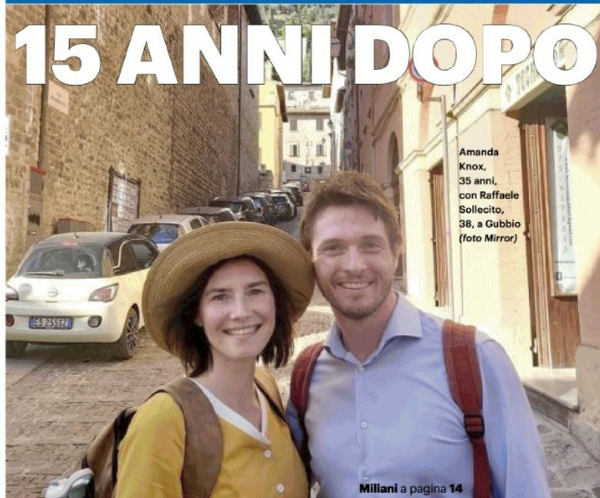
Amanda Knox, 35 anni, con Raffaele Sollecito, 38, a Gubbio