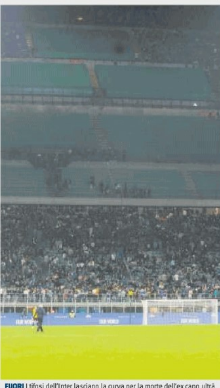
FUORI I tifosi dell'Inter lasciano la curva per la morte dell'ex capo ultra