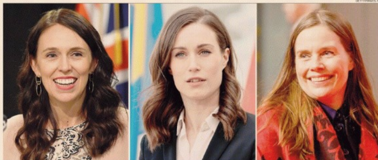
In cerca di nuovi modelli. Le prime ministre della Nuova Zelanda, Jacinda Ardern, della Finlandia, Sanna Marin, e dell'Islanda, Katrin Jakobsdóttir, unite per andare oltre il Pil