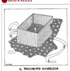
IL PACCHETTO SICUREZZA