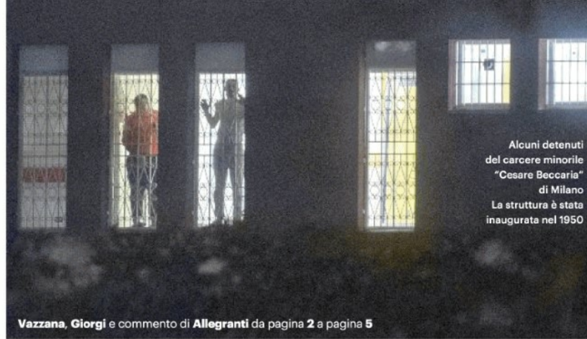
Alcuni detenuti del carcere minorile "Cesare Beccaria" di Milano. La struttura è stata inaugurata nel 1950

Vazzana, Giorgi e commento di Allegranti da pagina 2 a pagina 5