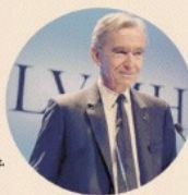
Bernard Arnault. Presidente e CEO di Lvmh

Dinastie Lvmh, Arnault blinda il patrimonio più ricco del mondo con un'acclamata e una data chiave