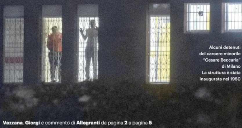
Alcuni detenuti del carcere minorile "Cesare Beccaria" di Milano. La struttura è stata inaugurata nel 1950

Vazzana, Giorgi e commento di Allegranti da pagina 2 a pagina 5