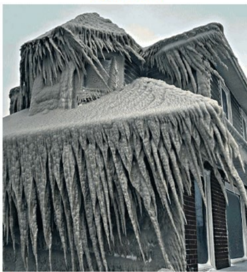
▲ Hamburg Un ristorante coperto di ghiaccio nello Stato di New York