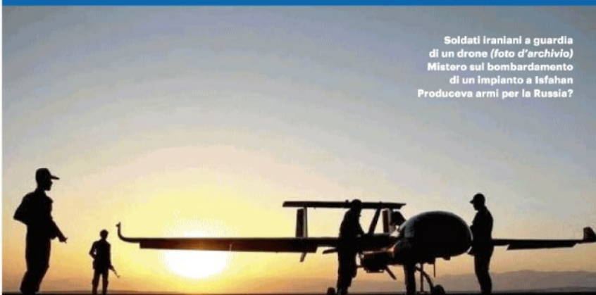
Soldati iraniani a guardia di un drone (foto d'archivio) Mistero sul bombardamento di un impianto a Isfahan Produceva armi per la Russia?

DRONI CONTRO SITO MILITARE IN IRAN. I DUBBI SU USA E ISRAELE L'IPOTESI: PRODUCEVA ARMAMENTI DESTINATI ALLA RUSSIA