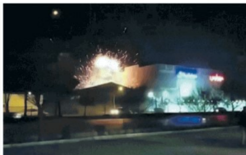
▲ Isfahan Il momento dell'esplosione nella fabbrica militare iraniana