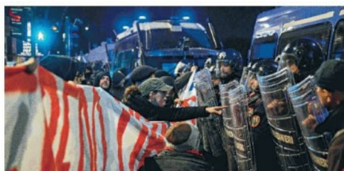
▲ Roma La protesta degli anarchici sabato sera a Trastevere

● alle pagine 2 e 3 con i servizi di Milella e Sannino