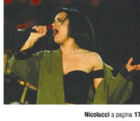
Nicolucci a pagina 17

Il fascino della città eterna Quarant'anni fa il mito di «Vacanze Romane» cantato dai Matia Bazar