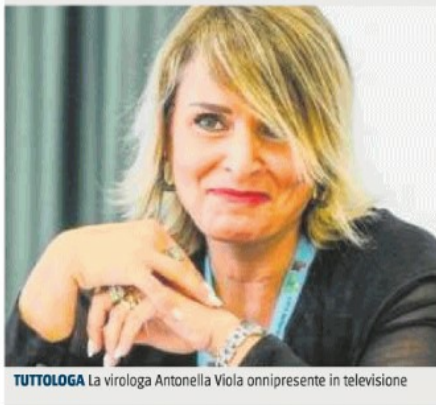
TUTTOLOGA La virologa Antonella Viola onnipresente in televisione