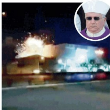
Iran Esplosioni nella notte. Sopra, mons. Ricchiuti

■ Attaccato l'impianto iraniano di Isfahan. La tv Al Arhabya accusa gli Usa, il Wall Street Journal, Israele. Il generale Usa Mlinhan: "Penso che nel 2025 combatteremo con Pechino"