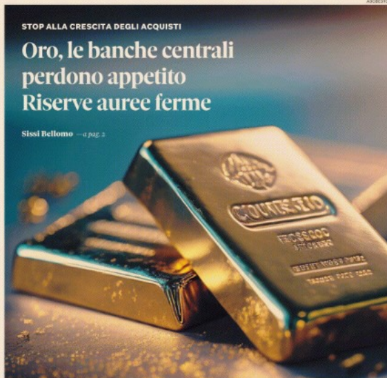
Beni rifugio. Lingotti venduti da numerosi Paesi, tra cui la Russia. La Cina continua a comprare