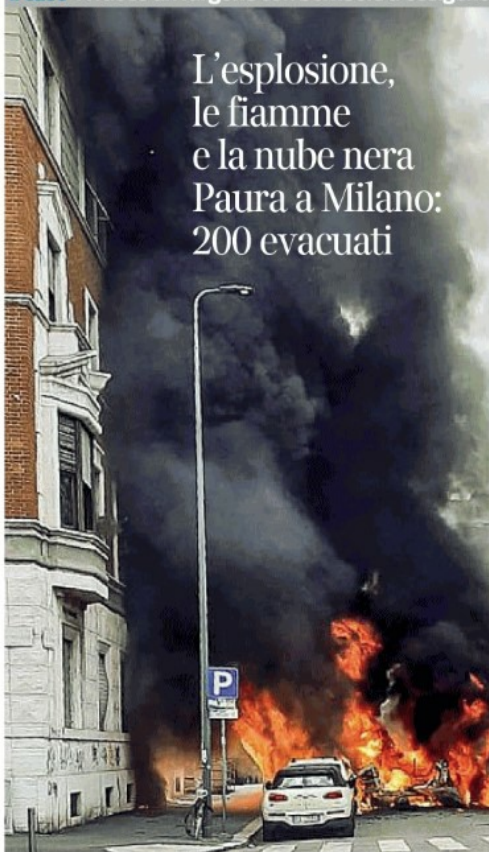
Fiamme e fumo nero, l'attimo dell'esplosione in via Pier Lombardo, zona di Porta Romana, a Milano

L'esplosione, le fiamme e la nube nera Paura a Milano: 200 evacuati