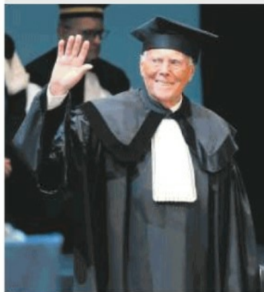
CERIMONIA La consegna della laurea honoris causa