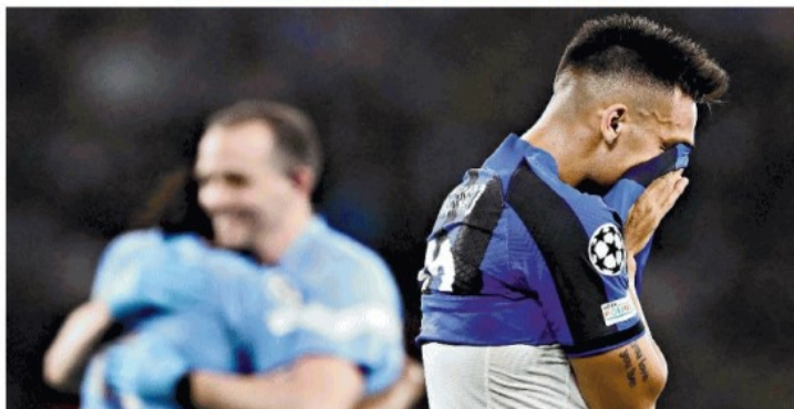
▲ Istanbul il giocatore dell'Inter Lautaro Martinez piange dopo la sconfitta