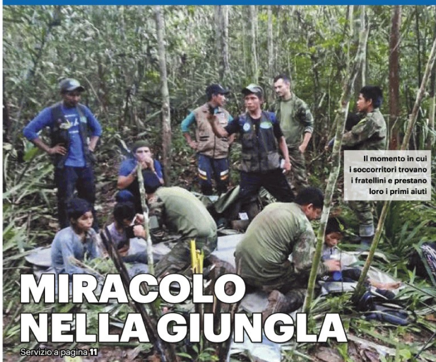
Il momento in cui i soccorritori trovano i fratellini e prestano loro i primi aiuti