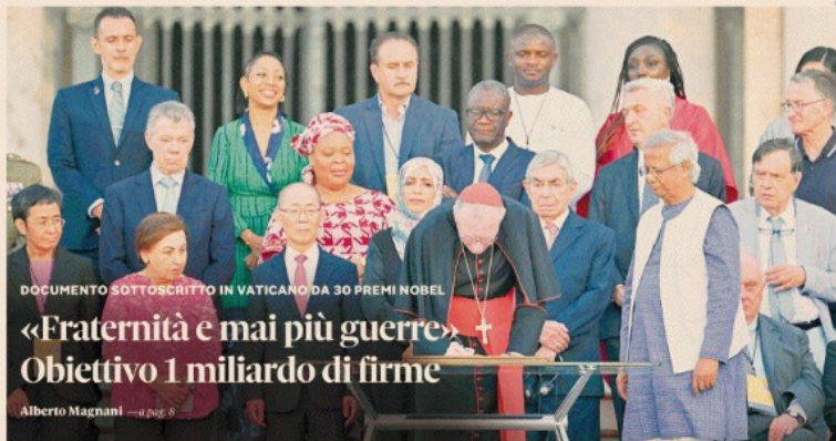
DOCUMENTO SOTTOSCRITTO IN VATICANO DA 30 PREMI NOBEL

Tra 2000 e 2020 in Italia i salari reali del manifatturiero sono cresciuti del 24%, in linea con la produttività e più di altri Paesi Ue; ma in questi ultimi la produttività è aumentata molto di più. Per questo la competitività delle imprese italiane è a rischio, sottolinea il rapporto del Centro studi Confindustria diffuso ieri. Nel 2021-2022 la distanza di redditività fra area euro e Italia si è ampliata. Investimenti penalizzati, va alleggerito il carico fiscale. Cruciale l'innovazione. Nicoletta Picchio — a pag. 5