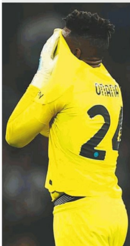
OCCASIONE PERDUTA Onana si dispera, l'Inter ha sprecato molto