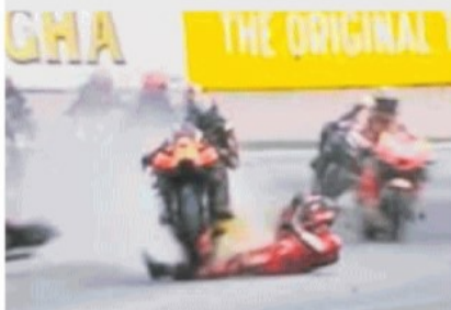
FERMO IMMAGINE Il momento dell'incidente di Pecco Bagnaia