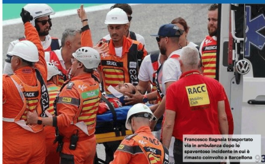
Francesco Bagnaia trasportato via in ambulanza dopo lo spaventoso incidente in cui è rimasto coinvolto a Barcellona

MOTO, NEL GP DI SPAGNA CADE E VIENE TRAVOLTO. ORA STA BENE