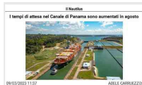
Panama City. Il tempo medio di attesa per le navi non prenotate per il transito nel Canale di Panama è aumentato tra il 44% e il 59% lo scorso mese, causa una prolungata siccità che ha portato a restrizioni sui transiti giornalieri e sui pescaggi delle navi. L'Autorità del Canale di Panama ha iniziato a imporre le restrizioni all'inizio di quest'anno con l'obiettivo di conservare l'acqua. Ad oggi, sono autorizzate a passare solo 32 navi/giorno con un pescaggio fino a 44 piedi (13,4 mt), contro 36 navi con un pescaggio massimo di 50 piedi (15,24 mt) in condizioni normali. Le limitazioni hanno portato a strozzature su entrambe le estremità del Canale; sono aumentate le tariffe di trasporto e hanno costretto alcune navi a deviare per evitare ritardi nelle consegne, soprattutto quelle che non hanno la priorità di passaggio. Secondo i dati dell'Autorità del Canale di Panama, il tempo di attesa è stato in media di 8,85 giorni per il transito in direzione sud e di 9,44 giorni per il passaggio in direzione nord nel mese di agosto, rispetto a 5,56 giorni e 6,55 giorni rispettivamente nel mese di luglio. Il tempo di attesa era più lungo per le navi da carico generale, le navi portarinfuse e le petroliere che trasportavano gas di petrolio liquefatto. I dati hanno mostrato che le navi portacontainer, le navi passeggeri, le navi mercantili refrigerate e le navi da trasporto veicoli sono state meno colpite. Secondo i dati comunicati venerdì scorso, il numero di navi in attesa per i transiti è sceso a 117 da un picco di oltre 160 navi all'inizio di agosto. "Per garantire che il Canale rimanga aperto al mondo del commercio, l'Autorità del Canale di Panama ha implementato misure strategiche negli ultimi mesi, per mitigare gli impatti dei cambiamenti climatici e della successiva stagione secca", si legge in una nota dell'Autorità. Le restrizioni già hanno determinato un impatto importante sullo shipping internazionale; gli shipper/caricatori devono pagare somme record se vogliono che i loro vettori riescano a superare un ingorgo di navi in attesa di attraversare il Canale di Panama colpito dalla siccità. Un caricatore ha recentemente pagato 2,4 milioni di dollari - oltre a una tariffa di transito standard di circa 400.000 dollari - per ottenere uno slot che consenta al suo vettore di attraversare la via navigabile più velocemente, ha dichiarato la Compagnia di navigazione Avance Gas Holding Ltd. la scorsa settimana. Per coloro che desiderano saltare la coda, l'Autorità del Canale di Panama organizza delle aste; una situazione anormale per cui una disfunzione infrastrutturale sta diventando fonte di guadagni, invece di agevolare il trasporto. "Puoi saltare la coda ma è immensamente costoso", ha affermato Oystein Kalleklev, amministratore delegato di Avance Gas. Intanto, Panama ha registrato un leggero aumento delle precipitazioni negli ultimi due mesi, determinando una stabilizzazione dei livelli dell'acqua del Canale dopo mesi di forte calo. Tuttavia, secondo gli esperti, la pioggia non è aumentata abbastanza