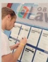
Attivazione. Il nuovo aiuto è legato alla frequenza di corsi o iniziative

Politiche attive: i nuovi percorsi dopo il reddito di cittadinanza