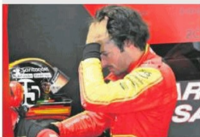
DISAVVENTURA Il pilota della Ferrari Carlos Sainz, terzo a Monza