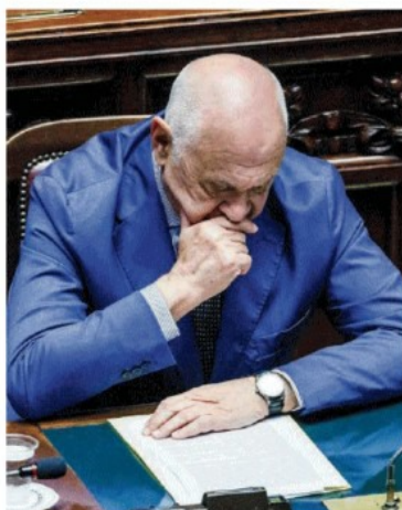
Chi rema contro Il ministro Carlo Nordio

Il Guardasigilli, oltre ai rave party, vuole istituire nuovi reati. Pretende che gli arresti li decidano 3 giudici anziché 1. E ricsuma la prescrizione che allunga i tempi, cancellata da Bonafede