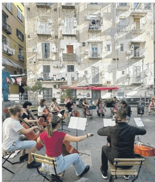
Concerto di violoncelli ai Quartieri Spagnoli in ricordo di Giogio Cutolo

Troppi minori armati e pericolosi a Napoli, parte l'appello al governo di pm e giudici partenopei: «Bisogna poter arrestare i minori che girano con le pistole». E non si piangono le reazioni al brutale omicidio del musicista