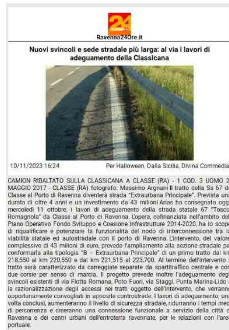
10/11/2023 16:24 Per Halloween, Dalla Sicilia, Divina Commedia CAMION RIBALTATO SULLA CLASSICANA A CLASSE (RA) - 1 COD. 3 UOMO 2 MAGGIO 2017 - CLASSE (RA) Il tratto della Ss 67 da Classe al Porto di Ravenna diventerà strada "Extraurbana Principale". Prevista una durata di oltre 4 anni e un investimento da 43 milioni Anas ha consegnato oggi, mercoledì 11 ottobre, i lavori di adeguamento della strada statale 67 "Tosco-Romagnola" da Classe al Porto di Ravenna. L'opera, cofinanziata nell'ambito del Piano Operativo Fondo Sviluppo e Coesione Infrastrutture 2014-2020, ha lo scopo di riqualificare e potenziare la funzionalità del nodo di interconnessione tra la viabilità statale ed autostradale con il porto di Ravenna. L'intervento, del valore complessivo di 43 milioni di euro, prevede l'ampliamento alla sezione stradale per conformarla alla tipologia "B - Extraurbana Principale" di un primo tratto dal km 218,550 al km 220,550 e dal km 221,515 al 223,700. Al termine dell'intervento il tratto sarà caratterizzato da carreggiate separate da spartitraffico centrale e con due corsie per senso di marcia. Il progetto prevede inoltre l'adeguamento degli svincoli esistenti di via Flotta Romana, Poto Fuori, via Staggi, Punta Marina-Lido e la razionalizzazione degli accessi nei tratti oggetto dell'intervento, che verranno opportunamente convogliati in apposite controstrade. I lavori di adeguamento, una volta conclusi, aumenteranno il livello di sicurezza stradale, ridurranno i tempi medi di percorrenza e creeranno una connessione funzionale a servizio della città di Ravenna e dei centri urbani dell'entroterra ravennate, per le relazioni con l'area portuale.