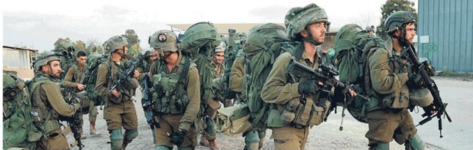
Soldati israeliani vicino al confine con Gaza, dove Tel Aviv ha fatto convergere 300 mila militari per l'operazione di terra SERVIZI / PAGINE 2-7