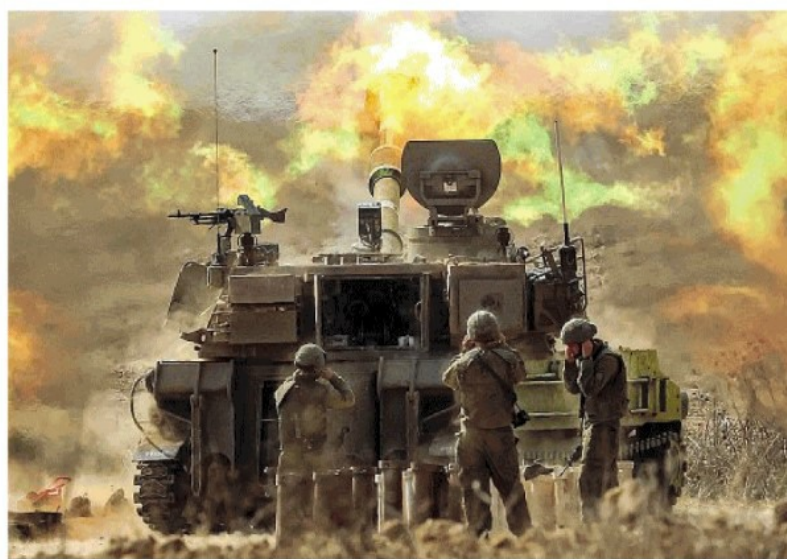
di Francesco Battistini e Davide Frattini da pagina 2 a pagina 12

Netanyahu trova l'accordo per formare un governo di crisi. Tajani: c'è un terzo italiano disperso