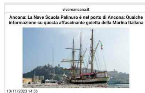
Ancona: La Nave Scuola Palinuro è nel porto di Ancona: Qualche informazione su questa affascinante goletta della Marina Italiana 10/11/2023 14:56 - Nave Palinuro svolge due compiti principali: offrire il supporto necessario alla formazione degli allievi sottufficiali e contribuire alla proiezione d'immagine della Marina Militare. La nave sarà visitabile nel Porto di Ancona Vivere Marche L'attuale nave Palinuro, varata nel 1934 con il nome "Commandant Louis Richard" nei Cantieri Navali Dubigeon di Nantes, in Francia, ha una storia ricca e affascinante. Inizialmente utilizzata per il commercio di pesca e trasporto del merluzzo nei Banchi di Terranova, la nave è diventata parte della Marina Militare Italiana dopo la Seconda Guerra Mondiale. La decisione di addestrare gli equipaggi sulla Palinuro ha preservato l'antica tradizione delle navi a vela. Dal 1955 ad oggi, la Nave Scuola Palinuro ha visitato numerosi porti nel Mediterraneo e nel Nord Europa, coprendo circa 300.000 miglia nautiche. Ha partecipato a prestigiosi raduni di imbarcazioni e navi d'epoca, nonché a regate delle "Tall Ships", caratterizzate dalle loro imponenti vele. La Palinuro è una "Nave Goletta" con tre alberi e un totale di circa 1.000 metri quadrati di superficie velica. La sua struttura è in acciaio chiodato ed è suddivisa in tre ponti, con alloggi per l'equipaggio, ufficiali e sottufficiali, nonché la cucina e la Plancia di Comando. La nave svolge due ruoli principali: supportare la formazione degli Allievi Sottufficiali e promuovere l'immagine della Marina Militare. Durante le campagne d'istruzione annuali, gli Allievi Marescialli affrontano settimane di formazione marinairesca, di sicurezza e di condotta della navigazione a bordo della Palinuro. Nei porti nazionali ed esteri, la nave testimonia le antiche tradizioni della marineria italiana, contribuendo così alla promozione dell'immagine della Marina Militare. Il motto della Nave Palinuro è "Faventibus Ventis", che significa "Con il favore dei venti", e il suo porto di assegnazione è La Maddalena. VISITE SULLA PALINURO Dall'11 al 13 ottobre la nave Nave Scuola Palinuro sosterà nel porto di Ancona e sarà ormeggiata presso il Molo Clementino. La goletta della Marina