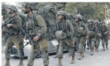
Genah, Guasco, Malfetano e Sabadin da pag. 2 a 4