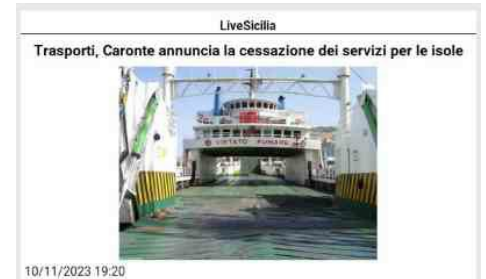
10/11/2023 19:20 MESSINA - "Dobbiamo purtroppo rappresentare l'impossibilità di assumere nuovi impegni contrattuali a fronte delle modalità di attuazione - da parte del Pm e della GdF delegata - del sequestro preventivo disposto a nostro carico con decreto del 23 maggio scorso emesso dal gip del Tribunale di Messina". Così, in una lettera, ha risposto, per il tramite del consorzio SNS, all'assessorato regionale delle Infrastrutture e della Mobilità che aveva urgentemente invitato la società a dare il proprio assenso all'inserimento dei servizi integrativi regionali a mezzo nave traghetto per le tratte con le isole Eolie, Egadi, Ustica e Pantelleria come estensione della convenzione col ministero dei Trasporti a partire dall'11 ottobre. La nota Nella nota, Caronte annuncia la cessazione dei servizi e ripercorre le tappe di una vicenda che "trae origine dal sequestro, avvenuto lo scorso giugno, di beni immobili, navi, crediti e partecipazioni per una cifra totale di quasi 29 milioni di euro con contestuale fermo di tre navi - sia pur munite di tutte le certificazioni di legge - adibite ai servizi regionali. Va ricordato che a ciò era seguita la risoluzione anticipata per "impossibilità sopravvenuta" dei contratti con la Regione per le linee verso le Eolie, le Egadi e Ustica, assicurandosi tuttavia una prosecuzione del servizio con altre navi fino al 30 settembre, in regime di libero mercato, ossia senza percepire alcun contributo pubblico. Ciò, per non creare ulteriori disagi alle comunità isolate e nel contempo per consentire alla Regione di avviare le procedure necessarie affinché il trasporto verso le isole minori potesse essere regolarizzato. Cosa che la Regione ha prontamente posto in essere, indicando le relative gare d'appalto e inviando le richieste di manifestazione d'interesse che però - per quanto se ne sa - non hanno avuto seguito". Una vicenda "delicata e complessa" "A impedire alla società l'assunzione di nuovi impegni con l'ente regionale - dice Caronte & tourist - in una situazione comunque delicata e complessa è stata un'ulteriore iniziativa - sempre della GdF d'intesa con il pm responsabile dell'esecuzione della misura - che ha visto sequestrare un'ulteriore somma in denaro di 2,8 milioni di euro che la Regione si accingeva a pagare all'azienda messinese per i servizi resi nel secondo trimestre del 2023 per i lotti relativi a Pantelleria e alle Pelagie (non interessate dal procedimento penale), al contempo liberando l'equivalente valore di una delle navi sequestrate (il cui utilizzo è rimasto comunque inibito)".