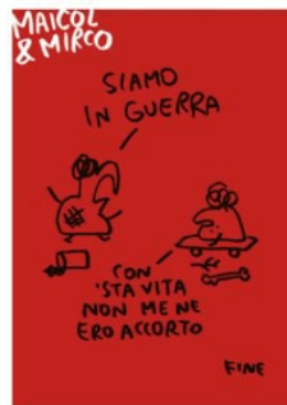
Photo: Italiane Sped. in a. p. - D.L. 353/2003 (conv. L. 46/2004) art. 1, c. 1. Gera/CRW/2312103