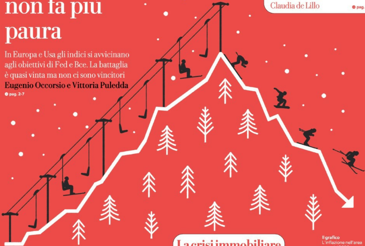
Il grafico L'inflazione nell'area euro dal 2020 a oggi