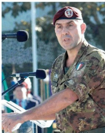
Dal campo alle librerie il generale Roberto Vannacci

■ Nell'intervista al "Fatto", il controverso ufficiale pensa alle Europee: "Buona parte della società è d'accordo con me. Ci sono minoranze che vogliono prevaricare la maggioranza"