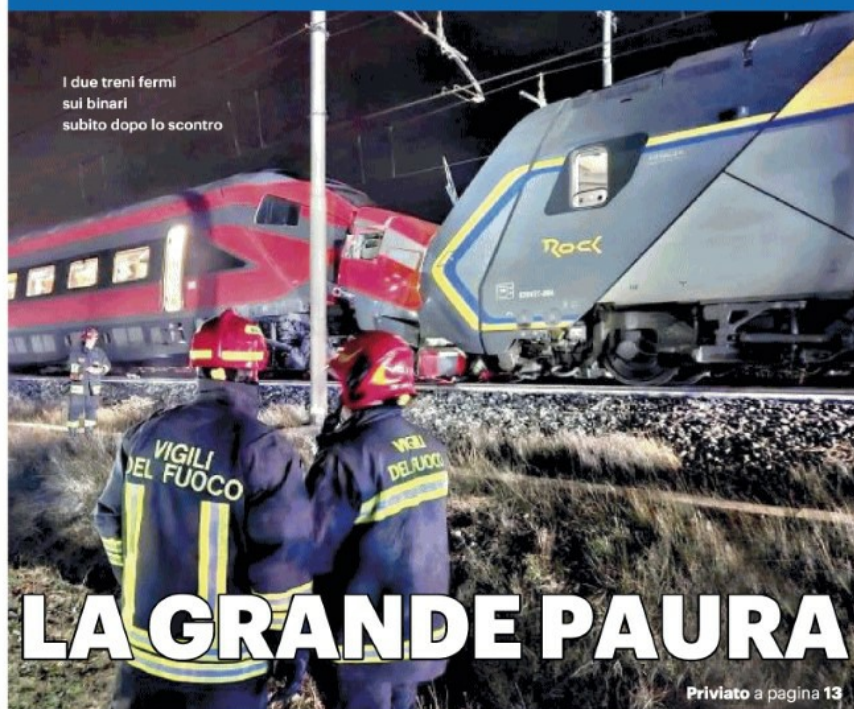
I due treni fermi sui binari subito dopo lo scontro

STRAGE SFIORATA LUNGO LA LINEA ADRIATICA TRA FORLÌ E FAENZA FRECCIAROSSA FINISCE CONTRO UN REGIONALE, 17 FERITI LEGGERI