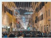
Meriani a pagina 15

Commercio Via allo shopping natalizio Centro preso d'assalto Boom di acquisti dell'enogastronomia