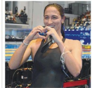
Schito a pagina 21

Continentali di nuoto La romana Quadarella regina d'Europa Suo l'oro dei 400 stile