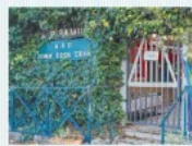
Zanchi a pagina 14

Testaccio Bocciofila ancora in stallo Chiesta da un anno la riconsegna al gestore Parte il sollecito dei vigili