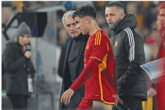
Carmellini, Cirulli e Pes alle pagine 18 e 19

Con la Fiorentina è 1-1: i giallorossi chiudono in nove Con la Fiorentina un punto d'oro La Roma perde Dybala e Lukaku