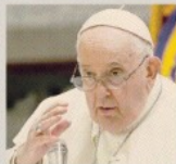
Il monito. Il Papa per una tregua