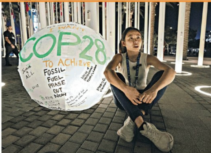
Dubai Una donna seduta vicino al globo di Cop28, la conferenza mondiale sul clima conclusasi ieri

di Fraioli, Modolo, Occorsio e Talignani alle pagine 2,3 e 4