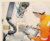
Prima volta. Superati i 4 miliardi di €