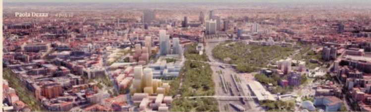
Rigenerazione urbana. Nei 350mila metri quadrati costruiti dell'area troverà spazio anche l'Accademia di Brera e il relativo studentato.