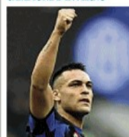
Lautaro Martinez, 26 anni