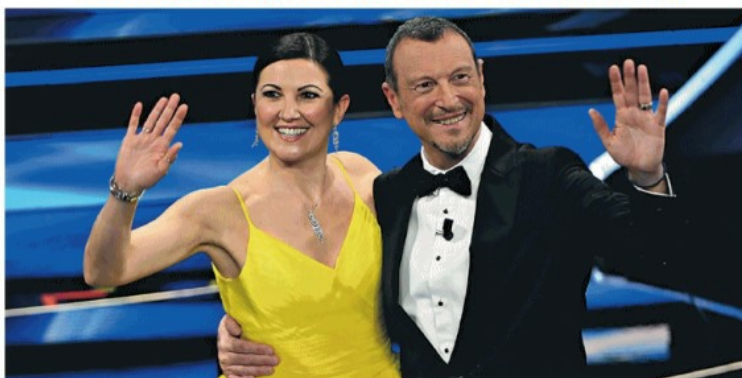
Il conduttore Amedeo Sebastiani - in arte Amadeus , 61 anni - con la moglie Giovanna Civitillo

Parla il conduttore a un mese dall'inizio della sua "quinta volta"