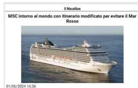
Il Nautilus MSC intorno al mondo con itinerario modificato per evitare il Mar Rosso 01/06/2024 16:36 Ginevra . MSC Crociere ha annunciato ai passeggeri che la nave MSC Poesia - in partenza ieri da Genova per la crociera annuale intorno al mondo - dovrà fare una grande deviazione a causa dei problemi di sicurezza nel Mar Rosso. Mentre gran parte dell'attenzione sulla sicurezza alla navigazione nel Mar Rosso si è concentrata sulle portacontainer, tra cui quelle della MSC, per il reindirizzamento delle loro gigantesche navi portacontainer, anche altri segmenti, tra cui quello crocieristico, hanno dovuto affrontare le sfide alla sicurezza alla navigazione. La nave da crociera MSC Poesia (92.627 tonnellate di stazza lorda) è partita ieri da Genova per l'epica crociera intorno al mondo di 121 giorni; i problemi di sicurezza, hanno costretto la nave lungo un itinerario contorto, mentre il direttore commerciale Gianni Pilato sottolinea che faranno comunque la maggior parte delle scalate già programmate. La compagnia MSC è stata anche in grado di mantenere i suoi programmi di crociere in Medio Oriente quest'inverno. La nave era stata programmata per fare scalo nel Mediterraneo prima di transitare nel Canale di Suez e percorrere la costa orientale dell'Africa navigando verso ovest. L'itinerario prevedeva un giro dell'Atlantico, circumnavigando l'Africa, attraversando poi il Sud America per i Caraibi fino alla costa orientale degli Stati Uniti e al Canada prima di tornare nel Nord Europa, con fine crociera in Germania. "La sicurezza dei passeggeri e dell'equipaggio è al primo posto per la nostra compagnia, quindi abbiamo dovuto necessariamente apportare modifiche per evitare il passaggio nel Mar Rosso", ha detto Pilato alla stampa. Ha osservato però che, "per fortuna, non gradite le strutture turistiche fisse, la nave può modificare gli itinerari a piacimento". Gli scali in Egitto, Giordania e Arabia Saudita hanno dovuto essere eliminati mentre la nave da crociera viaggia a ovest fuori dal Mediterraneo e a sud lungo la costa occidentale dell'Africa. Il nuovo itinerario prevede che la nave navighi doppiando il