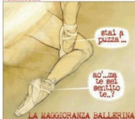
LA MAGGIORANZA BALLELINA