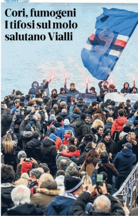
I tifosi radunati sul molo di Quinto per Vialli BASSO / PAGINA 48