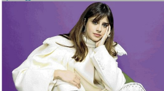
L'attrice Benedetta Porcaroli, 25 anni, protagonista assieme a Pietro Castellitto nel film «Enea» in uscita nelle sale italiane

Il personaggio L'attrice 25enne: mi ricordo che ci rimasi male, ero ferita