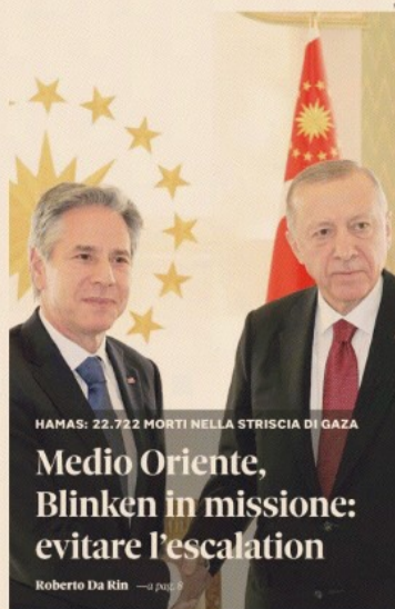
HAMAS: 22.722 MORTI NELLA STRISCIA DI GAZA