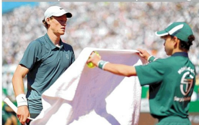
Il campione azzurro leri ha sofferto sulla terra rossa di Montecarlo a causa di un calo di energia poi superato dopo un medical timeout