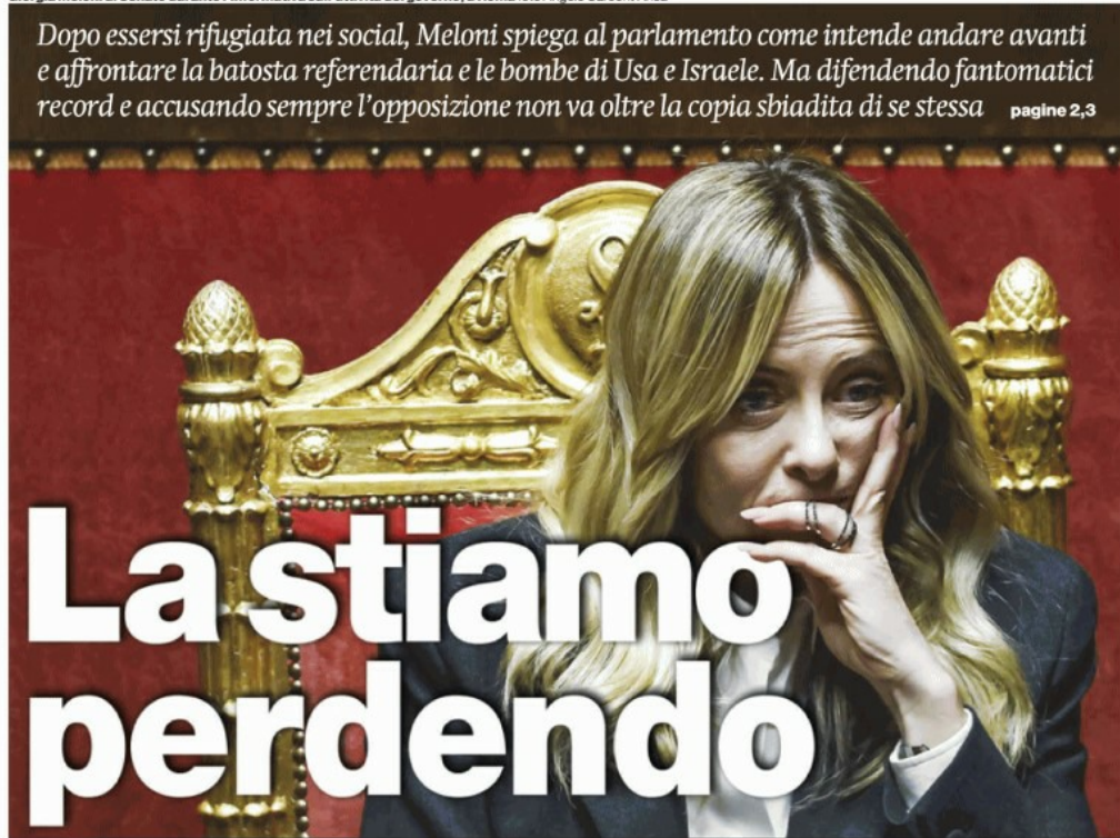
Giorgia Meloni al Senato durante l'informativa sull'attività del governo, a Roma

Dopo essersi rifugiata nei social, Meloni spiega al parlamento come intende andare avanti e affrontare la batosta referendaria e le bombe di Usa e Israele. Ma difendendo fantomatici record e accusando sempre l'opposizione non va oltre la copia sbiadita di se stessa pagine 2,3