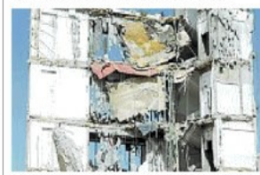
Un palazzo di Sidone, in Libano, distrutto dai raid israeliani

Prove di tregua. Mentre da Praga il presidente Sergio Mattarella ha puntato il dito contro i «bombardamenti devastanti sul Libano», Netanyahu ha detto sì ai negoziati con Beirut. Potrebbero tenersi già la settimana prossima negli Stati Uniti. Anche Russia e Turchia spingono per un cessate il fuoco. Ma Hormuz resta ancora chiuso. da pagina 6 a pagina 15