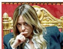
LOMBARDO, MAGRI, MALFETANO

Chi voleva capire come ha incassato Meloni la sconfitta al referendum, doveva ascoltare ieri mattina la sua "informativa" alla Camera. L'ha presa malissimo, non ci sarebbe altro da aggiungere. Se nel tremendo scenario di guerra che il mondo sta attraversando, una come lei dedica solo un inciso, vuol dire che questo è ciò che considera più importante. - PAGINA 23