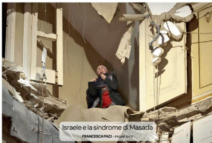
Israele e la sindrome di Masada

All'annuncio del cessate il fuoco tra Stati Uniti e Iran, il mondo ha tirato un mezzo sospiro di sollievo. Visti i presupposti apocalittici, con tanto di countdown finale, abbiamo tutti pensato di aver scampato il peggio. - PAGINA 23