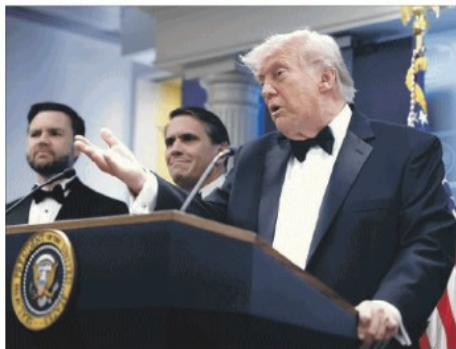
Il presidente Trump parla alla Casa Bianca dopo la sparatoria

Trump, gli spari alla cerimonia con la stampa e le vulnerabilità di un sistema. Tutto quello che sappiamo