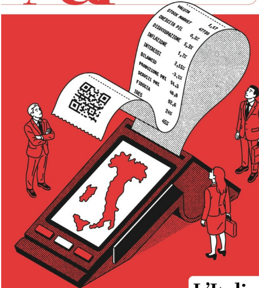
ILLUSTRAZIONE DI JACOPO ROSATI

Il candidato di Trump ha presentato i punti cardine Occorsio e Angeloni ● pag. 8-9