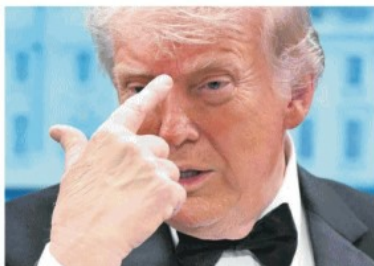
NEL MIRINO Il presidente degli Stati Uniti Donald Trump

Attentato alla cena di gala: Trump e Vance subito messi in salvo Il killer si descrive come «assassino gentile» Polemiche sulla sicurezza