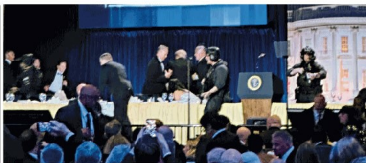
Washington, gli agenti della sicurezza circondano il presidente Trump dopo gli spari

Una scena da film di Fellini: il post della scrittrice Joyce Carol Oates su X illumina alla perfezione la notte di Washington, l'attentatore nudo per terra, l'agente ferito, il presidente Trump messo in salvo dal Secret Service, che chiede, con sangue freddo, di continuare la tradizionale cena con i giornalisti. La paura mista al grottesco, il ministro Kennedy che scappa lasciandosi dietro la moglie nel panico, il capo dell'Fbi Patel, accusato dalla rivista Atlantic di essere un beone, immobile al tavolo, come se il caos intorno non lo riguardasse. a pagina 14