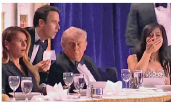
L'attimo degli spari: lo choc di Melania, del mentalista (col bigliettino) e di una reporter, Trump incerto. Sotto, gli ospiti sotto i tavoli

S taged, è la parola che rimbomba ovunque sui media: un attentato costruito a tavolino per distrarre l'attenzione degli americani dal guaio del presidente — la guerra in Iran, Epstein — e fargli recuperare almeno parte della popolarità perduta. È un'ondata che parte da X, la Rete di Elon Musk (sedicente sacerdote di un'assoluta libertà d'espressione, falsità comprese) e arriva, attenuata ma insinuante, fino ai grandi giornali: abituate da anni a sottoporre a fact checking le affermazioni di Donald Trump per dimostrare che mente, queste gloriose testate ora non accusano, ma disseminano gli articoli di indizi che possono far sorgere qualche dubbio. Nulla di concreto, al momento, giustifica questi sospetti, ma la sparatoria dell'Hilton di Washington non è solo una conferma del baratro di violenza politica nel quale sta scivolando l'America tra tentativi ripetuti di uccidere Trump, assassini e ferimenti di esponenti politici in vari Stati, fino alla famiglia del governatore della Pennsylvania che ha rischiato di morire nel rogo della sua casa, data alle fiamme da un attentatore. continua a pagina 34