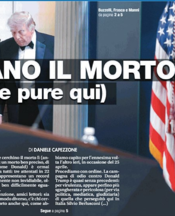
Buzzelli, Frasca e Manni da pagina 2 a 5

Trump ancora nel mirino Sparatoria alla cena di gala Il terzo attentato in 22 mesi E in Italia la situazione non è diversa Le squadracce rosse del 25 aprile dimostrano che la miccia è accesa Elly, Conte & Co. inseguono la deriva