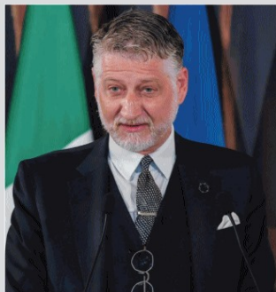
RISOLUTO Il ministro della Cultura, Alessandro Giuli