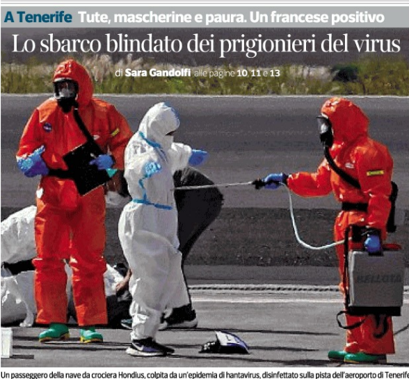
Un passeggero della nave da crociera Hondius, colpita da un'epidemia di hantavirus, disinfettato sulla pista dell'aeroporto di Tenerife