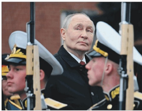
Il presidente russo Vladimir Putin sabato alla parata del Giorno della vittoria

Le paure del Cremlino, il disimpegno di Trump, le parole di Zelensky spiegano le prime caute aperture