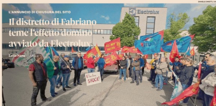
Electrolux... shock. È quanto si legge sui cartelli dei lavoratori in sciopero e assemblea davanti allo stabilimento dell'Electrolux a Cerreto d'Esi (Ancona)

L'ANNUNCIO DI CHIUSURA DEL SITO Il distretto di Fabriano teme l'effetto domino avviato da Electrolux