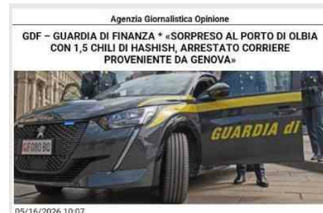
05/16/2026 10:07 GdF SASSARI: SORPRESO AL PORTO DI OLBIA CON UN CHILO E MEZZO DI HASHISH, ARRESTATO CORRIERE PROVENIENTE DA GENOVA I finanziari del Gruppo Olbia, durante le operazioni di sbarco delle motonavi in arrivo dal porto di Genova, Civitavecchia e Livorno, hanno tratto in arresto, in flagranza di reato con l'accusa di traffico di stupefacenti, un 54 enne originario della provincia di Napoli, trovato in possesso di un rilevante quantitativo di droga. L'operazione delle Fiamme Gialle olbiesi è scattata durante i controlli operati sui mezzi e passeggeri sbarcati dalla motonave Moby Orli proveniente da Genova, fortemente intensificati a ridosso del fine settimana e in concomitanza con le festività previste per San Simeone, patrono della città. Tra questi, particolare attenzione è stata rivolta al conducente di un'utilitaria, il cui atteggiamento nervoso, unitamente alle risposte evasive in merito alle ragioni del viaggio, ha destato sospetto nei militari che hanno deciso di procedere a un controllo più accurato con l'ausilio delle unità cinofile del Gruppo. A seguito della segnalazione dei cani antidroga Dante e Semia, particolarmente "attirati" dal mezzo, gli operanti hanno proceduto a effettuare una perquisizione più approfondita, all'esito della quale è stato scoperto, abilmente occultato all'interno dell'abitacolo, circa un chilo e mezzo di hashish sigillato sottovuoto al fine di renderne più difficoltosa l'individuazione. La sostanza, suddivisa in 3 panetti e circa un centinaio di ovuli, già pronti per la successiva cessione, qualora immessa sul mercato, avrebbe fruttato guadagni per un valore stimato in oltre 15.000 euro. Al termine delle operazioni il soggetto è stato tratto in arresto e posto a disposizione della Procura della Repubblica di Tempio Pausania, mentre la sostanza stupefacente è stata sequestrata unitamente al veicolo utilizzato dal corriere per il viaggio. L'attività di servizio, da inquadrarsi nel dispositivo permanente di contrasto ai traffici illeciti coordinato dal Comando Provinciale di Sassari, testimonia il continuo impegno del Corpo nella repressione del traffico di sostanze stupefacenti a tutela sicurezza e della salute pubblica, nonché del corretto presidio dell'economia legale.