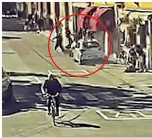
La Citroen C3 lanciata a folle velocità in pieno centro a Modena travolge i passanti sul marciapiede lungo la via Emilia, all'altezza di largo Porta Bologna, finendo poi la corsa contro le vetrine di un negozio di abbigliamento e rimbalzando a centro strada dopo avere schiacciato una donna