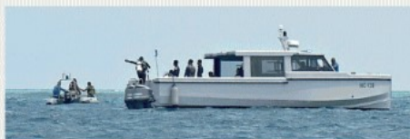
I mezzi militari delle Maldive impegnati nelle ricerche