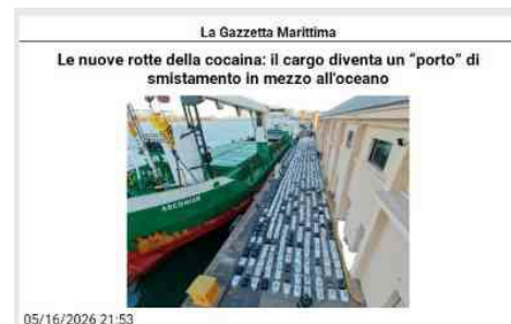
La Gazzetta Marittima Le nuove rotte della cocaina: il cargo diventa un "porto" di smistamento in mezzo all'oceano 05/16/2026 21:53 Le Fiamme Gialle nel blitz all'attacco del narcotraffico: sequestro kolossal nell'Atlantico CANARIE (Spagna). Stavolta il narcotraffico non l'hanno aspettato sulle banchine del porto per smantellarne la rete: sono andati a stanarlo sulle "autostrade della cocaina" in mezzo all'oceano. Non è un caso se al quartier generale della Guardia di finanza ne parlino come di «pionieristica operazione internazionale» in pieno Atlantico. Pionieristica anche perché hanno lavorato fianco a fianco le forze dell'intelligence e di polizia di stati che adesso a livello politico o si sono messi il musino l'un contro l'altro oppure se le stanno dando di santa ragione benché ex alleati. Complessivamente, oltre all'arresto di 54 persone, nell'intera operazione sono state sequestrate 10.906 chili di cocaina, 8.499 chili di hashish, 21 chili di marijuana, 29.773 litri di benzina, 18 navi e due veicoli. Stiamo parlando di "Alfa-Lima", il blitz coordinato dalla Guardia Civil che nella seconda metà del mese scorso ha dato un uppercut alla "Cocaine Highway", il corridoio dell'Atlantico orientale che le organizzazioni criminali usano per dribblare i controlli nei grandi scali portuali europei. Stessi giorni, stesso luogo: blitz contro un cargo Nello stesso periodo e nella stessa zona - l'oceano lato est, grossomodo dalle parti delle Canarie, 200 miglia a sudovest - è andata a segno anche un'altra gigantesca operazione antidroga della Guardia Civil: l'hanno chiamata "Abisal" e nelle stive del cargo "Arconian" ha scovato 30.215 chilogrammi di cocaina distribuiti in 1.279 balle. Gli investigatori iberici segnalano che «mai nella storia della lotta contro il narcotraffico era stato compiuto in un sol colpo un sequestro di questa entità». All'operazione "Alfa-Lima" ha partecipato la Guardia di finanza: il comando operativo aeronavale, di stanza a Pratica di Mare, ha mandato in azione un velivolo Atr72 e un equipaggio composto da 10 militari tra piloti, operatori di sistema e manutentori, rischierato presso le isole Canarie, effettuando un totale di 12 missioni