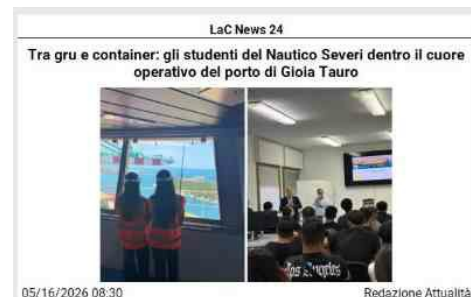
I ragazzi del triennio Trasporti e Logistica hanno visitato lo scalo osservando da vicino operazioni di banchina, logistica e navigazione commerciale. Momento centrale della visita l'accesso a bordo della MSC IDania. Redazione Attualità Tutti gli articoli di Attualità Uscire dalle aule per osservare dal vivo il funzionamento di uno dei principali porto del Mediterraneo: è stata questa l'esperienza vissuta dagli studenti del triennio dell'indirizzo Trasporti e Logistica - articolazione Nautico dell'IIS "F. Severi" durante la visita tecnica allo scalo di Gioia Tauro venerdì 15 maggio. Tra gru di banchina, centri di controllo, rimorchiatori e terminal container, gli studenti hanno potuto entrare dentro un sistema operativo costruito sulla sincronizzazione, dove ogni attracco richiede il coordinamento tra terminalisti, piloti, operatori portuali e compagnie di navigazione secondo tempi tecnici rigorosi che regolano movimentazione merci, sicurezza e gestione dei flussi logistici. La giornata si è aperta con un primo incontro con il raccomandatario marittimo Michele Mumoli, che opera nel coordinamento tra nave, terminal e autorità portuali. Agli studenti è stato illustrato il percorso operativo che accompagna l'arrivo di una nave commerciale: dalle pratiche documentali all'assistenza agli equipaggi, fino alla gestione delle comunicazioni tra i diversi soggetti coinvolti nelle attività portuali. Tra piazzali operativi, gru di banchina e file di container movimentati ininterrottamente, gli alunni hanno osservato da vicino il funzionamento di un'infrastruttura che governa traffici commerciali provenienti dalle principali rotte internazionali. Una visita costruita sul campo, dove termini studiati durante le lezioni, stivaggio, transhipment, catena logistica, intermodalità, hanno assunto una dimensione concreta. Particolarmente significativo l'incontro con il direttore generale di MCT, Carmine Crudo, che ha guidato gli studenti in un approfondimento dedicato all'organizzazione tecnica del terminal container. Dalle dinamiche