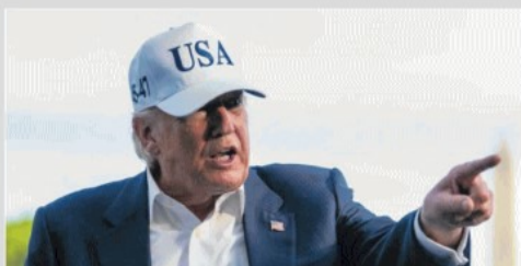
DECISO Il presidente degli Stati Uniti Donald Trump al suo ritorno dalla Cina

Cesare e Robecco alle pagine 10-11, con un commento di Fiamma Nirenstein