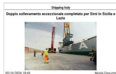
Shipping Italy Doppio sollevamento eccezionale completato per Simi in Sicilia e Lazio 05/16/2026 18:49 Nicola Capuzzo Scaricati e stoccati a Termini Imerese i primi manufatti per la parte siciliana progetto Tyrrenian Link di Terna Settimane intense per Simi, società abruzzese specializzata in trasporti eccezionali e montaggi industriali. A Termini Imerese sono infatti state portate a termine alcune operazioni legate al progetto Tyrrenian Link: "Abbiamo effettuato la scarico e lo stoccaggio di 3 trasformatori, ciascuno con un peso di 410 tonnellate" ha detto la compagnia in una nota. Tyrrenian Link è uno dei principali progetti infrastrutturali energetici attualmente in fase di sviluppo in Italia, in capo a Terna: un'interconnessione sottomarina ad alta tensione a corrente continua che collega Sicilia, Sardegna e Campania, volta a migliorare la stabilità della rete e a supportare l'integrazione di fonti di energia rinnovabile. Il progetto prevede la gestione di un totale di 12 trasformatori: 6 destinati alla Sicilia, 3 alla Campania e 3 alla Sardegna. All'interno di questo quadro, a Simi è stato affidato l'intero ambito delle operazioni di trasporto e posizionamento per tutte le unità. I trasformatori attualmente gestiti rappresentano le prime tre unità designate per la sezione Caracoli East. Le fasi successive prevederanno il trasporto alla centrale di Caracoli e il successivo posizionamento delle unità sulle loro fondamenta designate, attraverso molteplici operazioni di trasbordo e sollevamento pesanti per superare i vincoli logistici lungo il percorso. Pochi giorni dopo, poi, Simi ha completato con successo la prima delle quattro operazioni di scarico di altrettanti manufatti da 230 tonnellate, presso il porto di Civitavecchia: "L'attività è stata svolta utilizzando sistemi di sollevamento idraulici, garantendo precisione e sicurezza in ogni fase, seguita dal trasferimento e lo stoccaggio all'interno dell'area portuale tramite Spmt. Le operazioni continueranno con gli scarichi rimanenti, fino alla fase finale di carico sulla nave, completando così il ciclo operativo complessivo". ISCRIVITI ALLA NEWSLETTER QUOTIDIANA GRATUITA DI SHIPPING