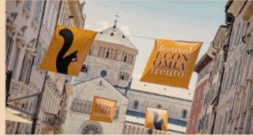
Gli eventi in città. Più di 300 incontri, oltre 700 relatori, 6 Nobel e 18 ministri