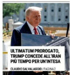
ULTIMATUM PROROGATO, TRUMP CONCEDE ALL'IRAN PIU' TEMPO PER UN'INTESA