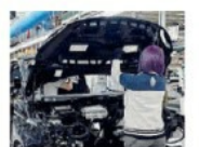
● TUNDO A PAG. 13

A POMIGLIANO D'ARCO Stellantis "ricida" un'e-car nel '28: non serve all'Italia