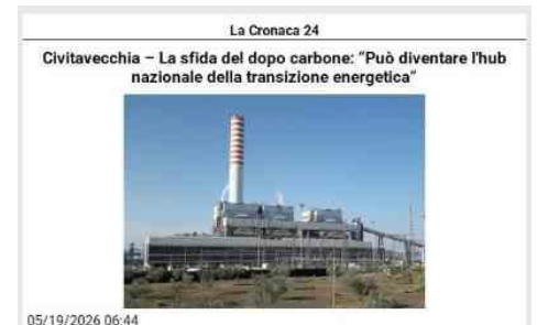
05/19/2026 06:44 Civitavecchia prova a ripensare il proprio futuro industriale e punta a trasformare l'uscita dal carbone in una grande occasione di rilancio economico. È il messaggio lanciato nel corso del convegno "Civitavecchia, modello di transizione energetica nazionale. Logistica, Economia Circolare, Economia del Mare e Nuove Energie", promosso da Unindustria con il contributo della Camera di Commercio di Roma nella sala conferenze dell'Autorità Portuale. Al centro dell'incontro il futuro del territorio dopo il phase out della centrale di Torrevaldaliga Nord, considerato da istituzioni e imprese non come una crisi irreversibile ma come il punto di partenza per una nuova fase industriale fondata su energia, logistica, economia del mare ed economia circolare. Al tavolo del confronto erano presenti rappresentanti delle istituzioni, del mondo imprenditoriale, della ricerca e degli investitori. Tra gli interventi quelli del sindaco Marco Piendibene, del presidente dell'Autorità Portuale Raffaele Latrofa, del presidente di Unindustria Civitavecchia Fabio Pagliari e del presidente di Unindustria Giuseppe Biazzo. Le conclusioni sono state affidate al ministro dell'Ambiente e della Sicurezza Energetica Gilberto Pichetto Fratin. Dal confronto è emersa una linea comune: il porto dovrà diventare il motore strategico della riconversione industriale, sfruttando le aree retroportuali e gli spazi industriali disponibili per attrarre investimenti e creare nuove filiere produttive. Tra i progetti richiamati durante il convegno figurano la Hydrogen Valley, la Comunità Energetica, i programmi di filiera, gli ITS e il collegamento Orte-Civitavecchia, considerati tasselli fondamentali per rilanciare il territorio. Ampio spazio è stato dedicato anche agli investimenti nei settori dell'idrogeno, della logistica avanzata e delle nuove energie. Gli operatori economici hanno confermato il proprio interesse verso Civitavecchia, ma hanno anche indicato alcune priorità ritenute decisive: la definizione del futuro della centrale di Torrevaldaliga Nord, la rimozione dei vincoli