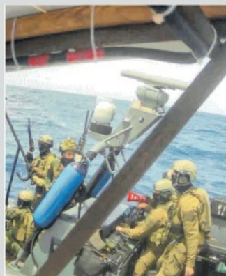
IL VIAGGIO Le imbarcazioni dirette verso Gaza