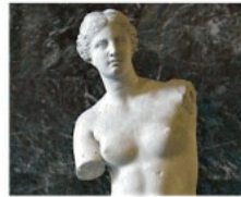
L'ANTICIPAZIONE / PAGINA 39

C'è una conchiglia sulla sabbia, poco lontano dal tuo fianco destro. E senti la schiuma che arriva sempre più in alto sino a bagnarti i piedi? Nella conchiglia e nella schiuma ci sono io, Afrodite, o Venere, se mai preferisci chiamarmi così.