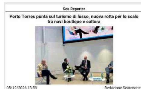
Mag 19, 2026 Cagliari - Una nuova fase di sviluppo per lo scalo del Nord Ovest sardo, sempre più orientato verso un turismo crocieristico culturale di fascia alta e mirato alla valorizzazione dell'identità locale. È questo il focus dell'appuntamento con l' Italian Cruise Day in Tour , organizzato dall' Autorità di Sistema Portuale del Mare di Sardegna in collaborazione con Risposte Turismo . L'incontro, tenutosi nella sala conferenze della sede di Porto Torres , ha riunito istituzioni, operatori ed esperti del settore per delineare le nuove strategie condivise per il futuro dello scalo. L'iniziativa, intitolata " Porto Torres sulla rotta di Giulio Cesare ", segna l'avvio di un percorso che punta a trasformare il porto da semplice punto di approdo a vera e propria destinazione esperienziale. All'incontro hanno preso parte numerosi rappresentanti istituzionali, tra cui l'Assessore regionale al Turismo Franco Cuccureddu , il Sindaco di Porto Torres Massimo Mulas , il delegato del Sindaco della Città Metropolitana di Sassari Gian Piero Madeddu , e il Presidente della Provincia della Gallura Settimo Nizzi . Presenti anche i Direttori Marittimi di Cagliari ed Olbia Giovanni Stella e Gianluca D'Agostino Al centro del confronto, il ruolo strategico del turismo crocieristico legato alle navi boutique, simbolo di un mercato orientato a esperienze autentiche e di qualità. Si tratta di un target esigente e ad alto valore aggiunto, capace di favorire la destagionalizzazione poiché spesso presente nei periodi di minore afflusso turistico. Come evidenziato dal Presidente dell' AdSP Domenico Bagalà , l'obiettivo è tracciare insieme la rotta del turismo crocieristico culturale di lusso, un segmento in forte crescita a livello globale che offre opportunità concrete di sviluppo economico per la filiera locale. Lo scenario in cui la Sardegna si inserisce è quello del Mediterraneo , un'area in costante espansione. Secondo i dati presentati da Francesco di Cesare , Presidente di Risposte Turismo , la crocieristica in Italia registrerà quest'anno 15,3 milioni di