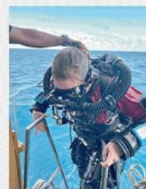
Il rientro a bordo dei sub finlandesi