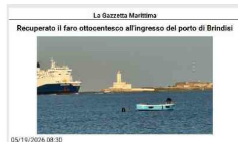
La Gazzetta Marittima Recuperato il faro ottocentesco all'ingresso del porto di Brindisi 05/19/2026 08:30 L'Authority ha speso 600mila euro. Il sindaco: è uno simbolo della città BRINDISI. Il faro e le strutture annesse presso le isole Pedagne sono state restituite alla città di Brindisi recuperando la funzionalità di uno dei simboli storici della città, all'ingresso del porto. I lavori hanno permesso di recuperare il faro dell'Isola Traversa: il tempo lo aveva deteriorato in modo significativo, il restauro ha ridato «solidità e funzionalità all'intero complesso» e ne ha valorizzato «l'identità storica e architettonica», com'è stato detto presentando il risultato dell'intervento. Il segnalamento marittimo, denominato "Faro Rosso", è stato realizzato a metà Ottocento sull'isolotto Traversa, che appartiene al nucleo di isole e rocce affioranti detto "Pedagne" che assieme alla Diga di Punta Riso, su cui è ubicato il "Faro Verde", di più recente costruzione, delimitano il porto di Brindisi e ne indicano l'obbligata via di accesso e di uscita. Sono state rimosse tutte quelle aggiunte che del faro avevano alterato l'aspetto originario, anzi ne avevano proprio compromesso l'armonia e la riconoscibilità: è stato deciso di conservarne soltanto una piccola traccia muraria, una sorta di «memoria delle trasformazioni avvenute negli anni, nel pieno rispetto della storia del sito». Il recupero è stato illustrato, nella ex sala Comitato della sede di Brindisi, dai vertici dell'Autorità di Sistema Portuale del Mare Adriatico Meridionale con il presidente Francesco Mastro e il segretario generale Francesco Di Leverano, alla presenza del sindaco brindisino Giuseppe Marchionna. Costo complessivo 600mila euro, li ha tirati fuori l'Authority barese. Vale la pena di segnalare che l'intervento è stato «particolarmente complesso per via dell'ubicazione del faro», com'è stato detto: un isolotto. E dunque? Da un lato, è stato necessario superare barriere logistiche; dall'altro, in nome della tutela della avifauna marina, è stato necessario sospendere l'attività in alcuni periodi perché il gabbiano corso è specie protetta e lì si riproduce tra marzo e luglio. Come sottolineato, l'intervento mira al recupero e alla valorizzazione dell'intero complesso.