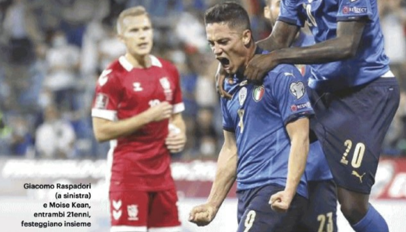
Giacomo Raspadori (a sinistra) e Moise Kean, entrambi 21enni, festeggiano insieme