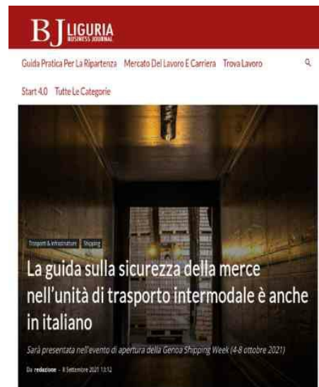
Il Cargo Integrity Group (CIG), di cui fanno parte le cinque organizzazioni internazionali Container Owners Association (COA).