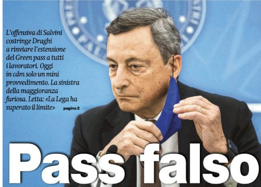
Mario Draghi

L'offensiva di Salvini costringe Draghi a rinviare l'estensione del Green pass a tutti i lavoratori. Oggi in cdm solo un mini provvedimento. La sinistra della maggioranza furiosa. Letta: «La Lega ha superato il limite» pagina 2