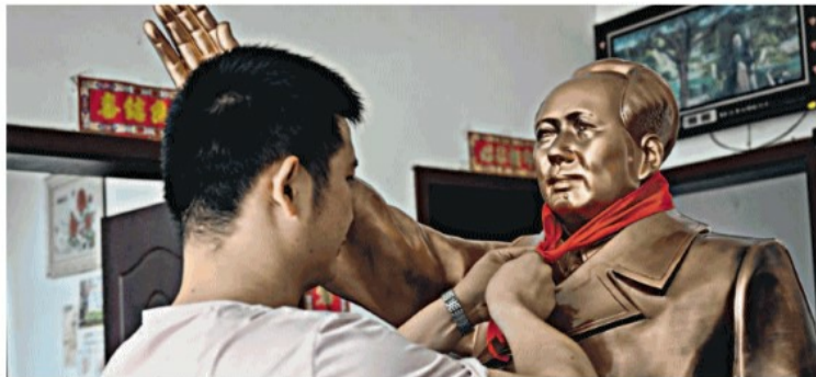
▲ Shaoshan Una statua di Mao Zedong nella sua Casa Museo

Boom di turisti cinesi per i 45 anni dalla morte