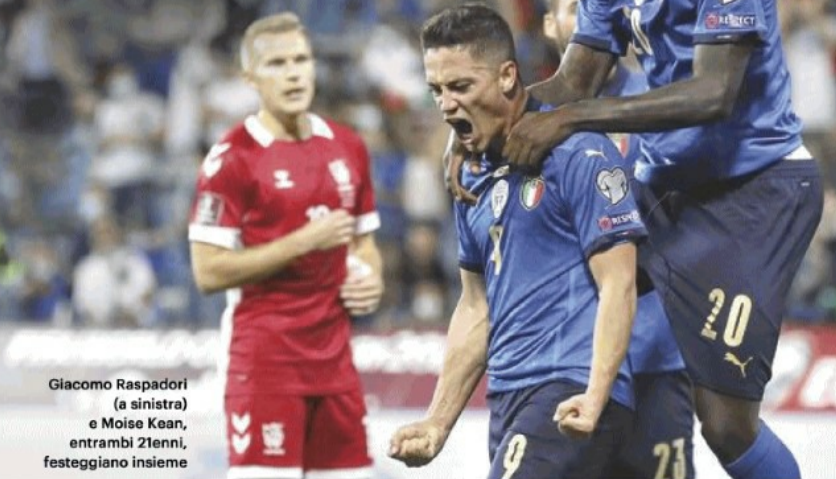
Giacomo Raspadori (a sinistra) e Moise Kean, entrambi 21enni, festeggiano insieme