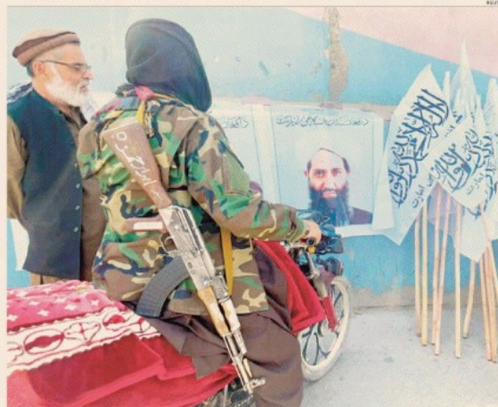
Governo senza competenze. Talebani davanti al poster del loro leader supremo, Habatullah Akhundzada