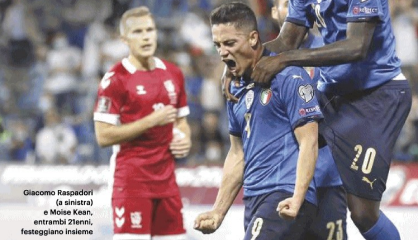
Giacomo Raspadori (a sinistra) e Moise Kean, entrambi 21enni, festeggiano insieme