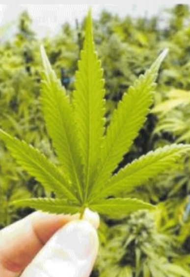
STUPEFACENTI La sinistra vuole sdoganare la cannabis

Pd e M5s regalano 4 piantine di canapa indiana a famiglia. Con un provvedimento accolto in commissione Giustizia alla Camera si dà il via libera al testo base che depenalizza la coltivazione della cannabis casalinga. Solo piantine femmine però, quelle dalle infiorescenze ricche di cannabinoidi. E che sia il prelude alla liberalizzazione della marijuana è l'accusa pesante che muove il centrodestra ai giallorossi.